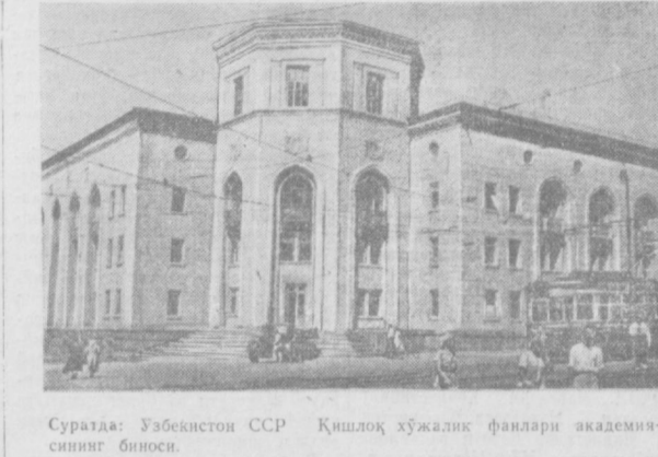
Суратда: Ўзбекистон ССР Қишлоқ хўжалик фанлари академиясининг биноси.