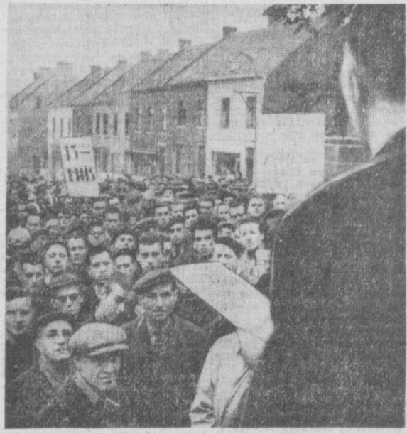
БЕЛЬГИЯ. Бир ойда, ортиқ вақтдан буён Клабека шахрида металлургия ишчиларининг забастоси давом этмоқда. Улар иш ҳақини оширишни талаб қилаётирлар. Ишчилар маъмурият томонидан талаблари қондирилмагунча ишга чиқмасликка қарор қилганлар. Суратда: Клабека шахрида иш ташлагачи металлургиянинг митинги.

Тошкент, «Правда Востока» кўчаси, 26-уй.