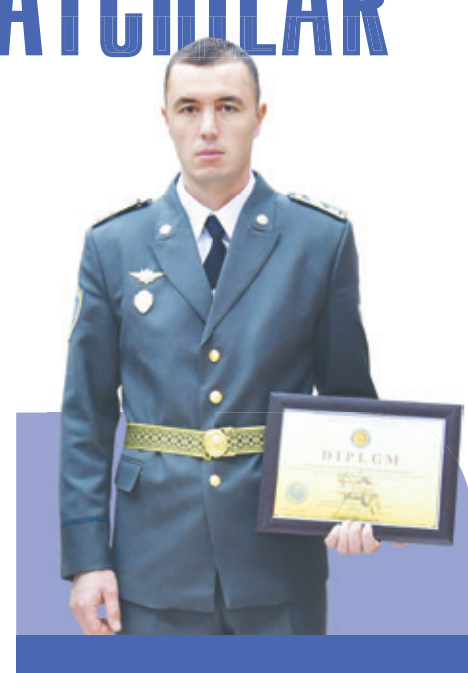
SHARAFLI KASBGA MUHABBAT

Ha, yuqorida ta'kidlaganimizdek, mardlik, fidoyilik, jasorat bizga bobomeros. Ular go'zal tarbiya bilan avloddan avlodga o'tadi. Shundan bo'lsa kerak, qahramon yigitning hayot yo'li nurli, munavvar. Buni har qancha e'tirof etsak arziydi.