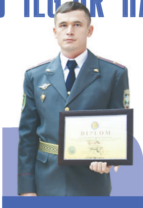
MUVAFFAQIYAT – TAJRIBA MAHSULI

– Yurt tinchligi va osoyishtaligini saqlash shu diyorda unib-o'sgan har bir o'g'lonning muqaddas burchi, deb bilaman. Yuragim to'ridan joy olgan burch tuyg'usi, Vatanga muhabbat hissi meni har doim shu yurt uchun mardonavor ishlar qilishga undaydi, – deydi qahramonimiz. – O'tgan kunlarga nazar tashlar ekanman, ko'nglimda ajib hislar jo'sh ura boshlaydi. Zero muborak istiqloq sabab armiya va harbiy xizmatning nufuzi oshdi, harbiylik sharafli kasblardan biriga aylandi. Bugun zamonaviy qurol-yarog' va texnika bilan ta'minlangan, milliy qadriyatlarimiz va ajdodlarimizning jangovar an'alariga tayangan milliy armiyamiz bor, uning safida esa yuksak jismoniy tayyorgarlik, intellektual salohiyatga, ruhiy-ma'naviy fazilatlariga ega bo'lgan Vatan himoyachilari xizmat qilyapti. Bizga shijoat, mardlik, jasorat, yurt uchun jon kuydirish ajdodlarimizdan meros. Vatan biz uchun har narsadan qadrlidi. Uning tinchligi va osoyishtaligini saqlash uchun jonimizni ham ayamaymiz. Chunki biz yurtning ishongan tog'i, qo'rg'onlarimiz. Albatta, bu ishonch harbiy xizmatchilarga kuch bag'ishlaydi. Doim mardonavor ruh bilan faqat olg'a intilishga undaydi.