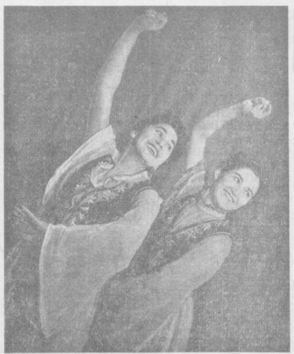
Икки барно, икки сулув Чарх айланиб расга тушар. Ҳар юракка бериб сурур. Севинчларга севино қушар.