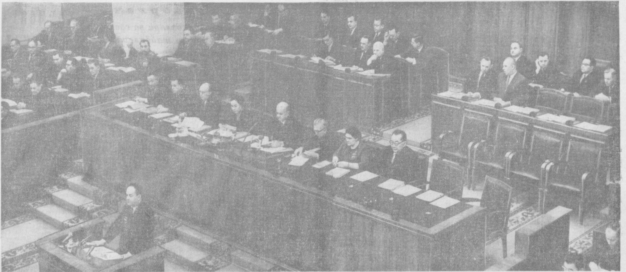
БУТУН ДУНЕ ПРОЛЁТАРЛАРИ, БИРЛАШИНГИЗ!