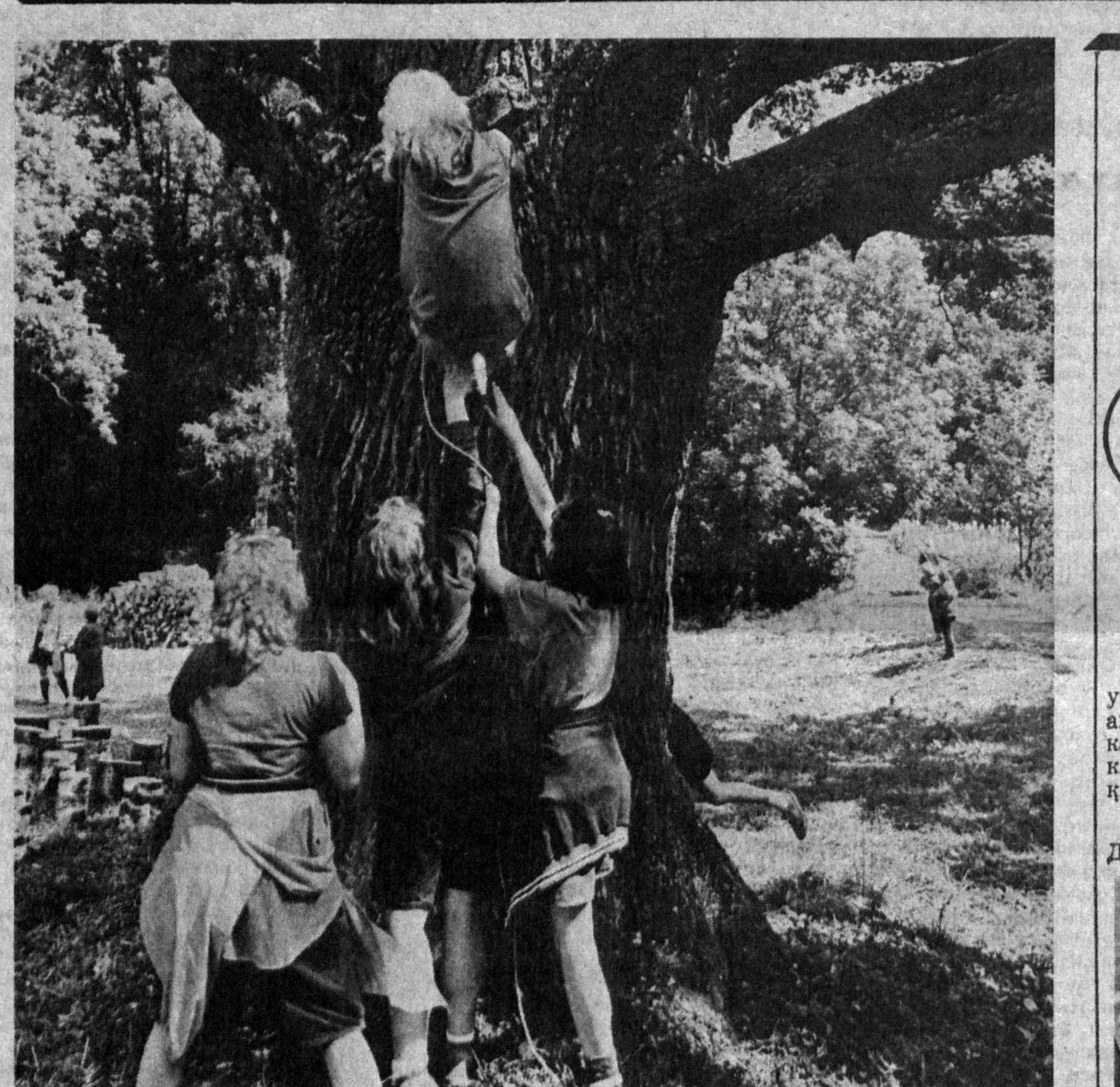
Сиаулар деган сўзнинг асл таркимаси йўқ. Бу ҳарбий-сиёсий тусдаги болалар ташкилотининг аъзоси. Бундай ташкилот Латвияда анчадан бери фаолият кўрсатиб келади. Лекин кейинги йилларда бу уюшманинг ҳаракати тўхтаб қолган. Мана 50 йил ўтган, фақат қизлардан иборат бўлган сиауларнинг биринчи сўти бўлиб ўтди.

«Азиз Елена Сергеевна» бўлди, кино — ва театр вариантлари ҳам. Яхшироқлари бўлди, ёмроқлари бўлди. Лекин «Илҳом»идagi спектаклнинг «Бир нафасдан» бошқаровчи эди. Бунада Вержицкийнинг (унинг ҳамроҳларининг ҳам, албатта) дикссаси ҳам эмас. Унинг Володяси, бошқаровдан фарқи йўроқ форт мараз, разил эмас эди. Чунки ўқитувчи-