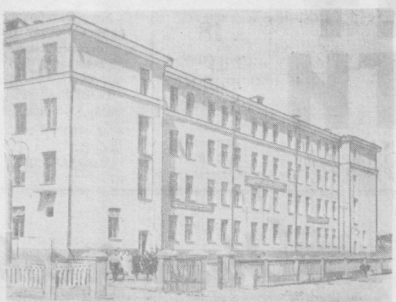
Ташкил қилинган Қўриқ қўриқчилар заводи посёлкида 900 ўқувчига мўлжалланган янги мактаб биноси қурилди. Суратда: «Октябрь» 40 йиллик мактаби биносининг умумий қурилиши.

Партия ва ҳукуматимизнинг қарорини билан мамлакатимизнинг турли районларидан бу ерга минглаб ва таъинларварлар келиб ишламоқдалар. Улар қарқаб ётган ерларни ўзлаштиришда, чўл бағрига суя чиқаришда, қолхоз, совхозлар ташкил қилишда, янги шаҳар ва посёлкалар барпо этишда зўр жонбозлик кўрсатаётдилар.