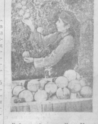
Боёвут районидagi Карл Маркс номи колхозда мевазор боллар йилдан-йилга кенгайтирилмоқда. Шу кунгача Янгийер ва Тошкент бозорларига 200 тоннадан ортиқ ҳар хил мевалар жўнатилди. Колхоз болдорчинидан бир миллион сўмдан ортиқ даромад қилди. Суратда: колхоз анорасрида.