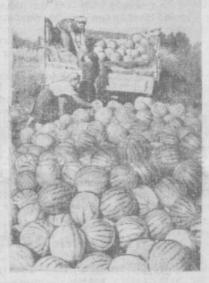
«Вревский» совхозиди мевачилик, сабзавот ва узумчилик йилдан-йилга ривожлантирилмоқда. Совхоз ўтган йил йиллик планини ортиги билан бажариб, 1 миллион 30 минг сўм даромад қилган эди. Бу йил эса бундан ҳам кўпроқ даромад олини учун курашляётди. Суратда: тарвузалар шаҳар аҳолисига жўнатилмоқда.