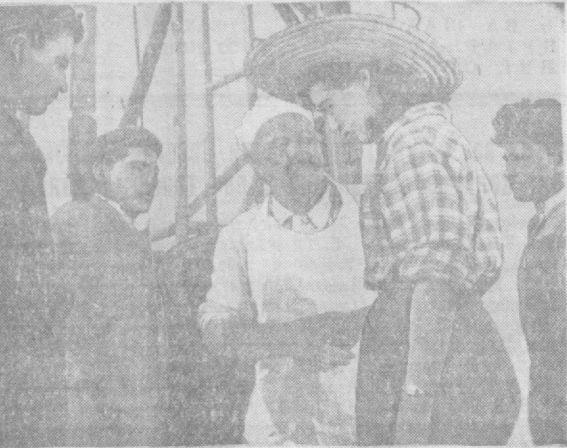
Суратда: «Гуллар очилганда» кинофильмидан кадр.