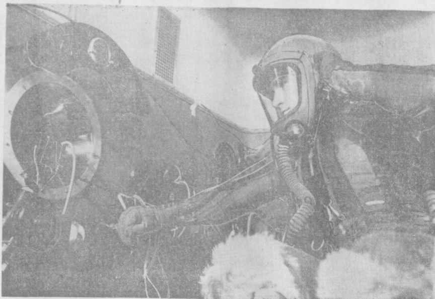
Барокамеранинг ичи. Дам ўтмай «Жуда катта баландликка қўтарилиш» бошланади.

Совет кишилари Ернинг биринчи сунғий йўлдошини яратиб, космосни эгаллаш даврини бошлаб бердилар, тарихнинг янги саҳифасини очдилар. Инсоннинг бошқа планеталарга саёҳат қилдиган куни яқин. Бироқ, бу орзунинг ҳақиқатга айланшидан олдин турли ихтисосдаги олимлар бўлажак осмон сайёҳларининг тамомилда хавфсиз бўлишини таъминлаш билан боғлиқ бўлган жуда кўп масалаларни ҳал қилишлари керак.