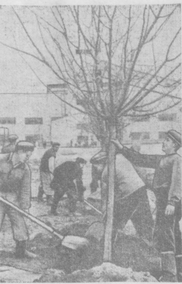
Суратда: шаҳарни кўкаламзорлаштириш хўжалиги трести ишчилари йирик насабдаги уйлари уйлари комбинати территориясига дарахт ўтказмоқдалар.

1952 йилда бизда жамоатчилик фойдаланадиган кўклатлар майдонига ҳар бир кишига 2,5 квадрат метрдан тўғри келган бўлса, кейинги 8 йил мобайнида бу норма 3,9 квадрат метрга етди.