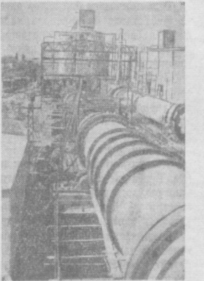
Суратда: клинкер қуйдирувчи янги печь.

Бинокорлар кўлга киритилган ютуқ билан қаноатланиб қолмадилар. Чунки улар цемент комбинатининг иккинчи технологик линиясини ҳам фойдаланишга топширишлари керак эди.