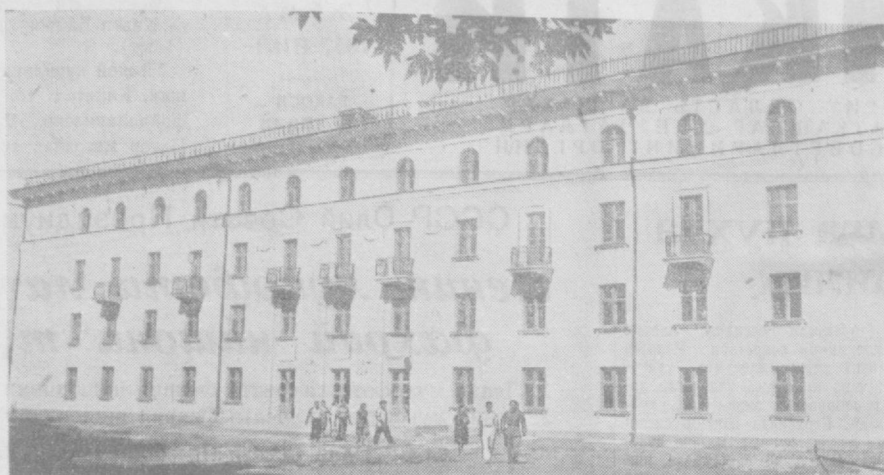
Тошкентда кўп қаватли муҳташам уй-жой бинолари сони тобора кўпайиб бормоқда. Суратда: Тошкент медицина институти студентлари учун қурилган ва яқинда фойдаланишга топширилган 500 кишилик ётоқхона биносининг умумий кўрinishи.

Паркент районидagi барча бошланғич партия ташкилотларида коммунистлар ҳамда партиясида активларнинг иштирокида ўтказилган йилликларда партия ва ҳўкуматнинг уй-жой қурилиши ҳақидаги қарори муҳокама қилинар экан, меҳнаткашларнинг уй-жойга бўлган эҳтижини қондириш, шунингдек қишлоқда маданий-маиший бинолар қурилиши кенг йўлга қўйиш соҳасида кейинги йилларда қувончли натижаларга эришилганлиги алоҳида таъкидлаб кўрсатилди. Район кўлхозларида ўтган йили 350 оила янгилан қурилган уйлارга кўчиб кетди. Шу йилнинг ўзида 8 ойна мобайнида 254 кўлхозчи оиласи учун уй қурилди. Биргина «Коммуна» кўлхозида бўлимас фонд ҳисобидан 14 ҳўжалик учун уй қуриб берилди. Ишчи ва хизматчилар томонидан яқка тартибда уй-жой қуриш тобора кенг туш олмақда. Кейинги вақтда 23 оила давлат томонидан қўрсатилган ёрдамга таяниб, янги уй-жой қуриб олди. Ҳозирги вақтда МТС ходимлари учун уй-жой қуриш қизғин бораётган. Районда уй-жой қурилиши билан бир қаторда, маданий-маиший ва ҳўжалик бинолари қурилиши кучайиб кетган. Кейинги вақтда 23 оила давлат томонидан қўрсатилган ёрдамга таяниб, янги уй-жой қуриб олди. Ҳозирги вақтда МТС ходимлари учун уй-жой қуриш қизғин бораётган.