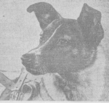
Лайка номан ит. Бу ит ҳозирги вақтда Ернинг иккинчи йўлдошининг герметик кабинасида саҳбат қилиб юрибди.

13 ноябрда Корал-Харбор — соат 0-04 минутада, Форт-Рей — соат 1-36 минутада, Дауссон — соат 3-09 минутада, Нейп ери — соат 3-59 ми-