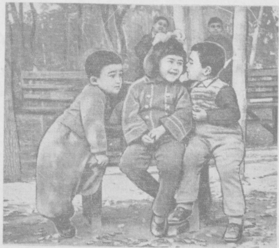
Сирли сўхбат.