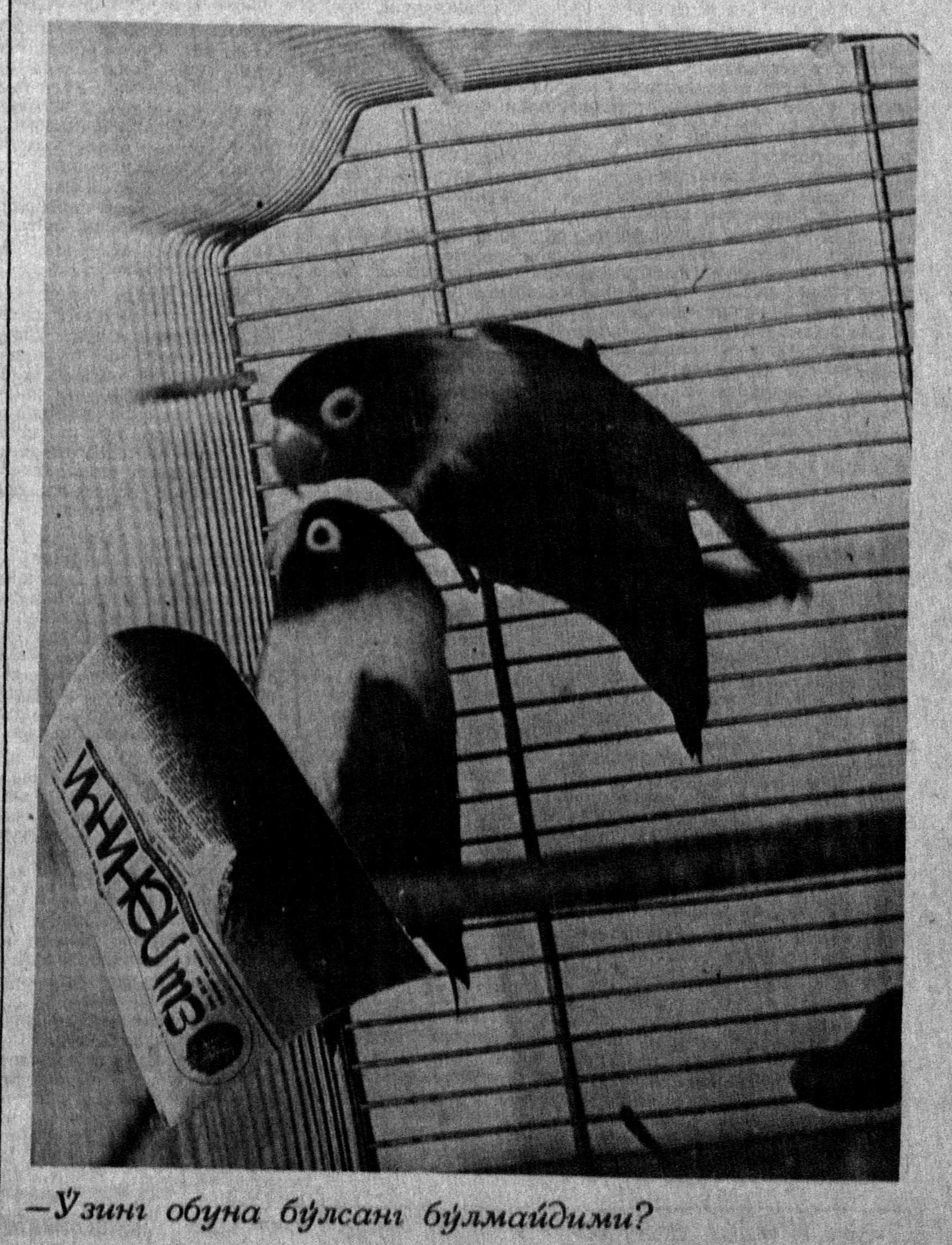
—Узинг обуна бўлсанг булмайдингми?

Биз «Еш ленинчи» рўномасини севиб ўқиймиз. Айниқса шу куннинг долзарб мавзуларида ёзилган, одоб-ахлоқ, «Бир рубобнинг икки тория» сажифаси мақолалари билан мунтазам танилиб борамиз.