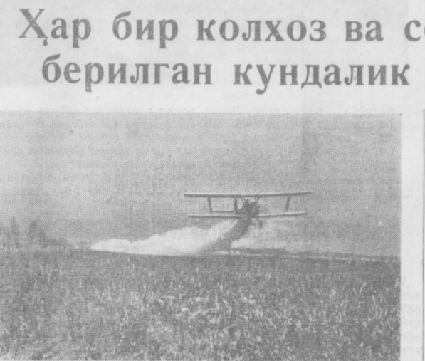
Янгиёул районидagi Ҳиданов номли колхозда келгуси йил мўл ҳосили учун барча тадбирлар амалга оширилмоқда. Сурада: ерларга шудгор қилишдан олдин самолёт билан суперфосфат семирмоқда.

Сийсий ағтиришнинг бутун маъмути ҳозирги кунинг вазибаларида бўлиши лозим. Агитаторлар кенг сайловчилар ўртасида лекция ва суҳбатларни кўрсатиш, алоқадорларнинг ўзларини кенг қийитиб юбориш керак. Сийсий ағтиришнинг бутун маъмути ҳозирги кунинг вазибаларида бўлиши лозим. Агитаторлар кенг сайловчилар ўртасида лекция ва суҳбатларни кўрсатиш, алоқадорларнинг ўзларини кенг қийитиб юбориш керак.