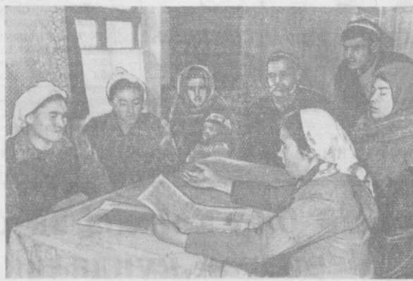
Янгийўла районидagi Ленин номи колхозининг сайлов пункти хузурида ташкил қилинган агитпунктда сайловчилар ишлари қилиниб, сайловчилар ўртасида оммавий-сиёсий ишлар кучайтирилмоқда.