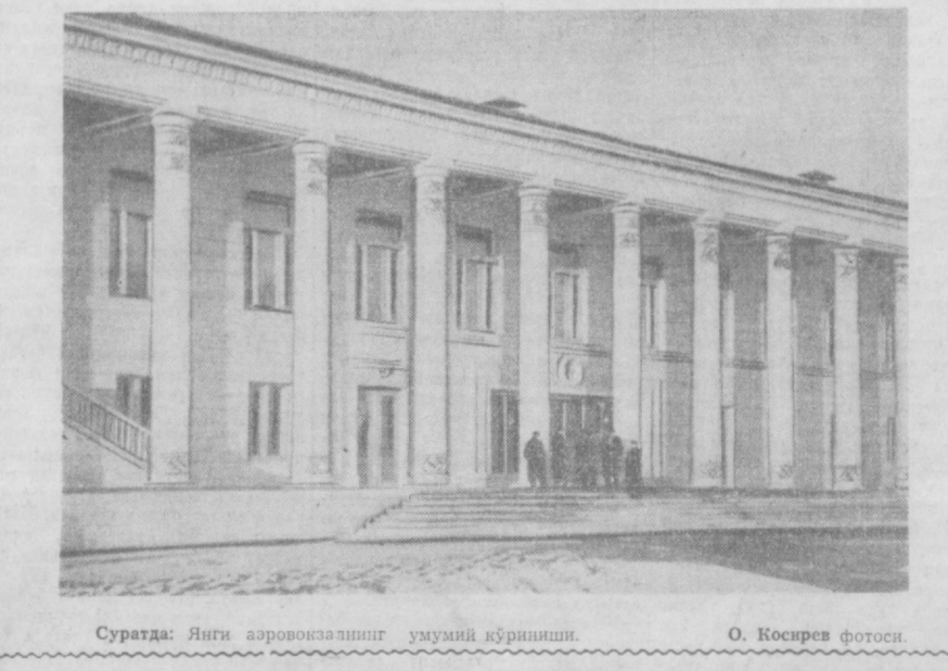
Суратда: Янги аэровокзалнинг умумий кўриниши.

Миллий шаклда чиройлик қилиб ишланган бу бино мамлакатдаги қардош республикалардан олинган нафис меъбел билан жиҳозланган.