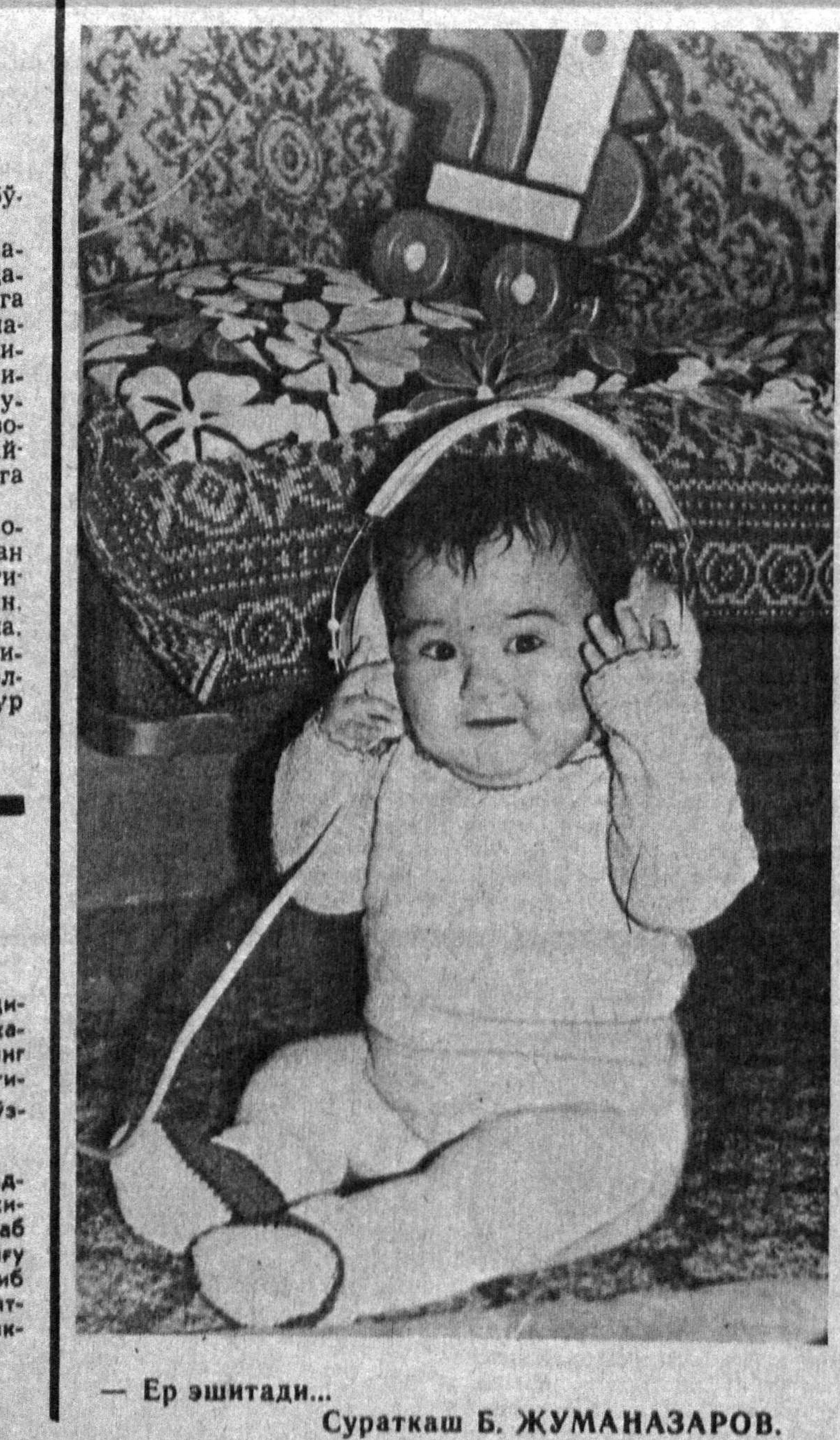
— Ер эшитида... Суратқаш Б. ЖУМАНАЗАРОВ.