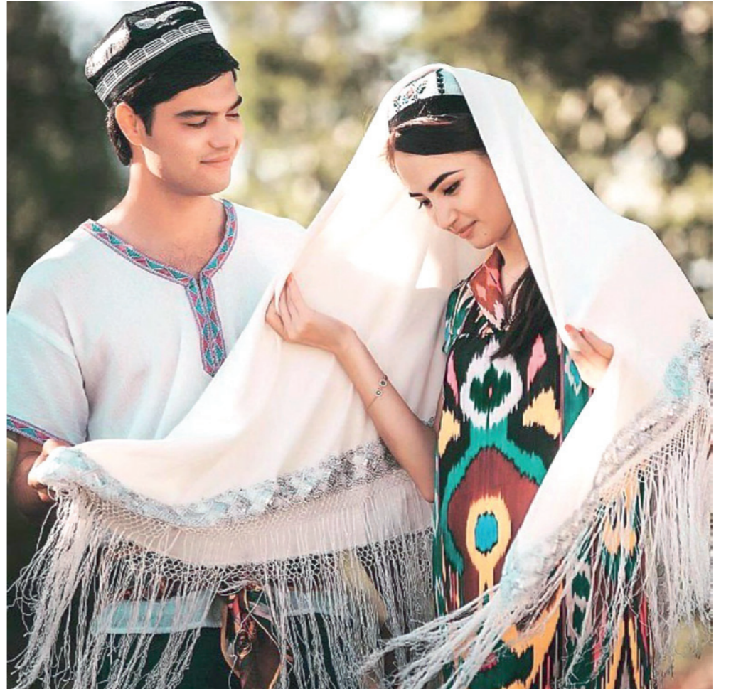
Оилаларнинг аксарияти ўзини бахтли ҳис қилиши, ҳаётга кўтаринки руҳ ва келажакка ишонч билан қараши, ҳаётинг мақсадлари ҳамда режалари борлиги, муаммо ва қийинчиликларни халқимизга хос бўлган шуқроналик ҳисси орқали енгиб ўтиши аниқланди.

Оилалар бахтлилик даражасига таъсир кўрсатувчи асосий омилларга биринчи навбатда фарзандларнинг