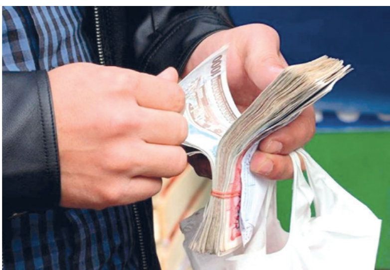
Эслаиб ўтаамиз, ҳозирги кунда мамлакатимизда меҳнатга ҳақ тўлашнинг энг кам миқдори — 1 050 000 сўмни ташкил қилади.

Ишсизлик нафақаси бир йилда 26 ҳафта, яъни 6,5 ой тўланади. Бу нафақани олиш даврида ишсиз шахс иш қидириши ва ишга жойлаштиришга доир йўлланма ( қасбга тайёрлашга, қайта тайёрлашга ) олиш учун икки ҳафтада камида бир марта маҳаллий меҳнат органига мурожаат қилиши шарт. Энг қизиғи, ушбу нафақани олиш учун ҳеч қайси давлат ҳокимияти органига боришингиз шарт эмас, уйингиздан туриб бундан биринчи навбатда “ty.gov.uz” сайтга кириб рўйхатдан ўтиш зарур. Кейин ундан “Соҳалар” бўлимининг