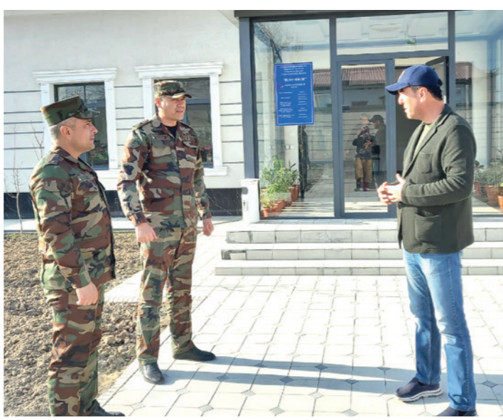
Маҳалла раиси оилавий ажралишларни олдин олиш бўйича ҳуқуқ-тартибот органи ходимлари билан фикр алмашмоқда.

Аввало, никоҳ қайд этишда маҳаллани ваколатли орган қаторига киритиш керак. Яъни