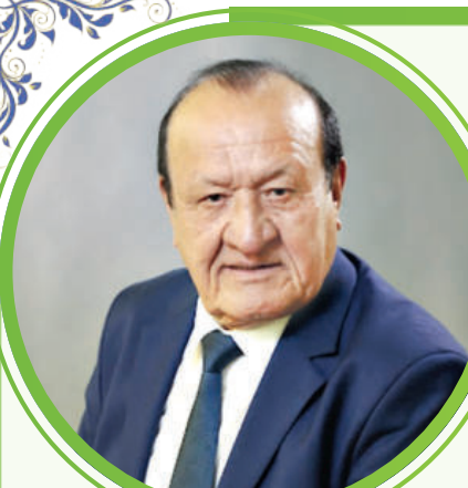
Эркин КОМИЛОВ, Ўзбекистон халқ артисти:

— Ўша пайтдаги спектаклларни қайта қўйиш, классик асарларни йўқотмаслик керак. Аниққисса, буюк сиймоларимиз, тарихий шахсларимиз, жадидлар ҳақидаги спектакллар саҳнадан тушмаслиги лозим. Зеро, бугун жадидлар деганда кимларни тушунасиз, деб савол