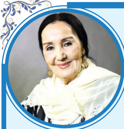
Рихси ИБРОҶИМОВА, Ўзбекистон халқ артисти:

Спектакль тарихига назар солар эканмиз, уни томошабин қалбига етказишда муносиб ҳисса қўшган ва қўшиб келатган Ўзбек Миллий академик драма театри актёри ва актрисаларининг ҳам мазкур саҳна асари ҳақидаги сўзларига қўлоқ тутдик.