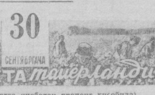
(Социалистик мажбуриятга нисбатан процент ҳисобида)