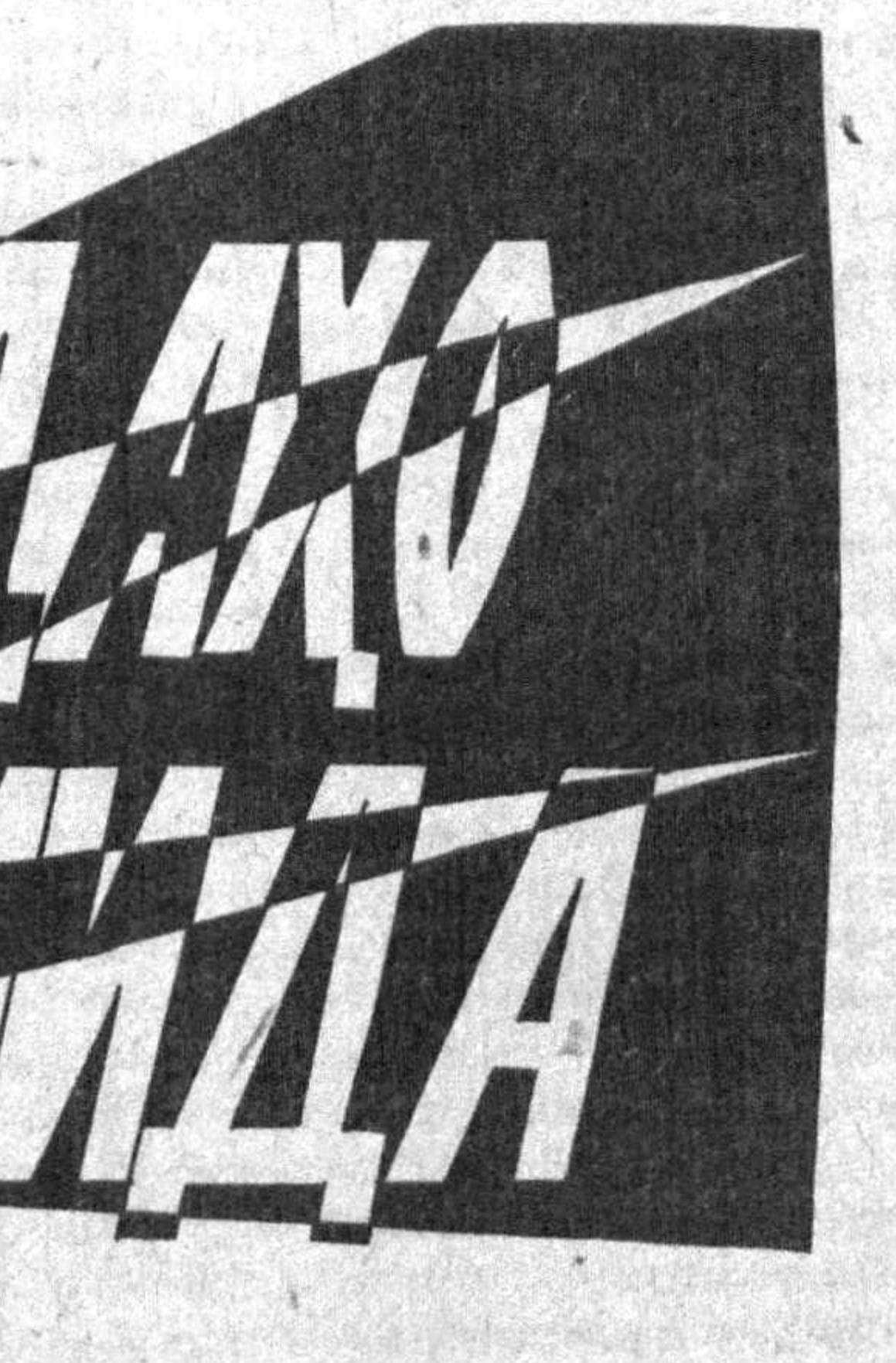
Усмон НОСИРнинг сўнги кунлари

Усмон Носирнинг сўнги кунлари, асосан таълим ва унинг ҳақида қўйилган сўрашларни кўришни