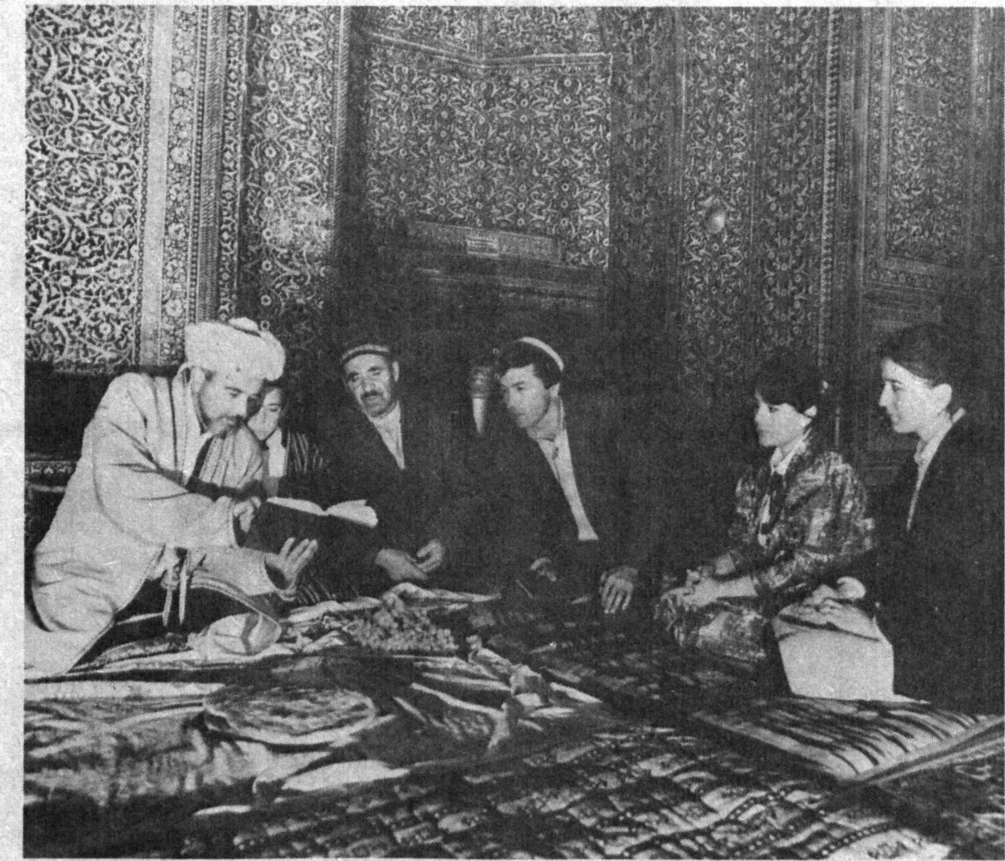
ХОРАЗМ ВИЛОЯТИ. Паҳлавон Маҳмуд мақбараси Хивадаги қадимий обидалардан бири. Яқинда шу обида яна динга сингирувчилар иномига тошпирилди. 1960 йилда бу ер атенслар уйига айлантирилган. Гап шундаки унинг 338 рубонисда ҳаёт қувончлари ва ташвишлари, руҳиятдаш воқиялари. Шоянинг ижоди билан шуғулланувчи тарғиботчилар уни шунга асосланиб ҳудосизга айлантиришган. Аслида у айдон кишиларнинг динни қурол қилиб. Ўз манфаатлари йўлида фойдаланишига қарши чиққан. Айни мана шу факт