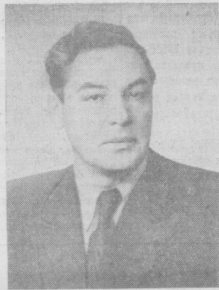
Д. Т. Шепилов.