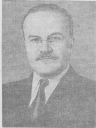
В. М. Молотов.