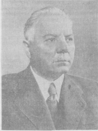
К. Е. Ворошилов.