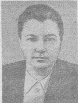
Е. А. Фурцева.