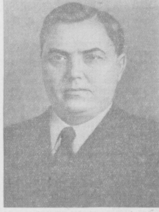
Г. М. Маленков.