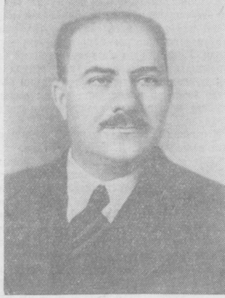
Л. М. Каганович.