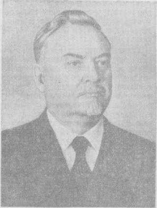
Н. А. Булганин.