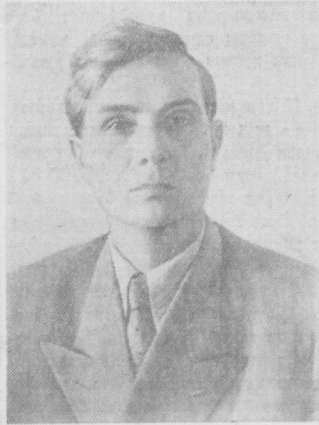
М. А. Суслов.