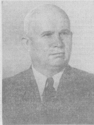
Н. С. Хрущев.