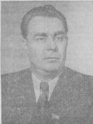
Л. И. Брежнев.