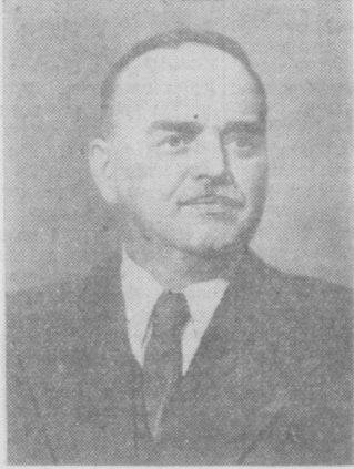
Н. М. Шверник.