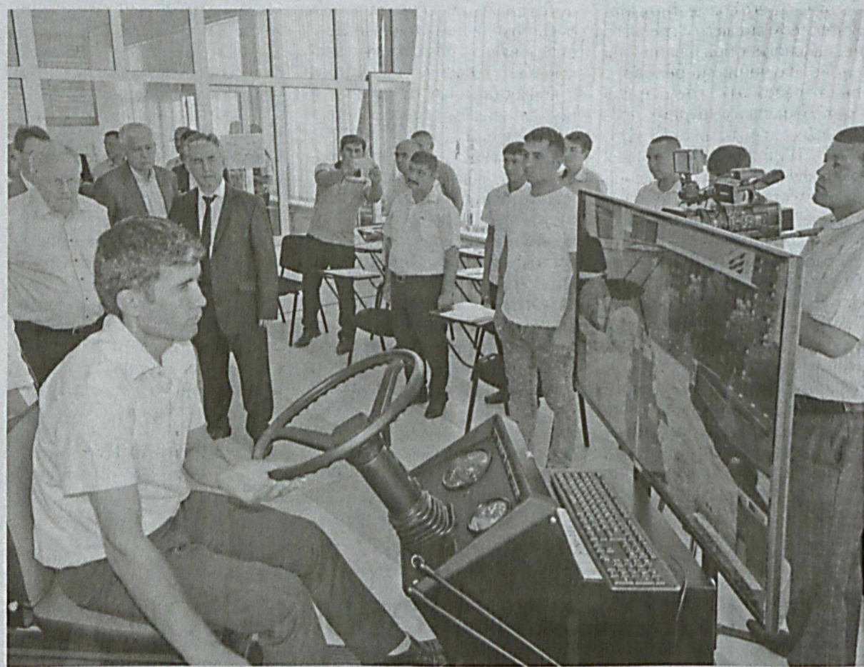
■ Прибывшая в нашу страну в рамках узбекско-швейцарского бизнес-форума делегация во главе с федеральным министром экономики, образования и научных исследований Йоханном Шнайдер-Амманом побывала в Самарканде.

На семинаре, состоявшемся в гостинице "Grand Samarqand", обсужден ряд проектов в образовательной и коммунальной сферах. Затем швейцарцы посетили Самаркандский профессиональный колледж компьютерных технологий и гидрометеорологии. Гости ознакомились с деятельностью регионального центра профессиональной подготовки, организованного в рамках IV фазы узбекско-швейцарского проекта "Развитие профессиональных навыков в Узбекистане".