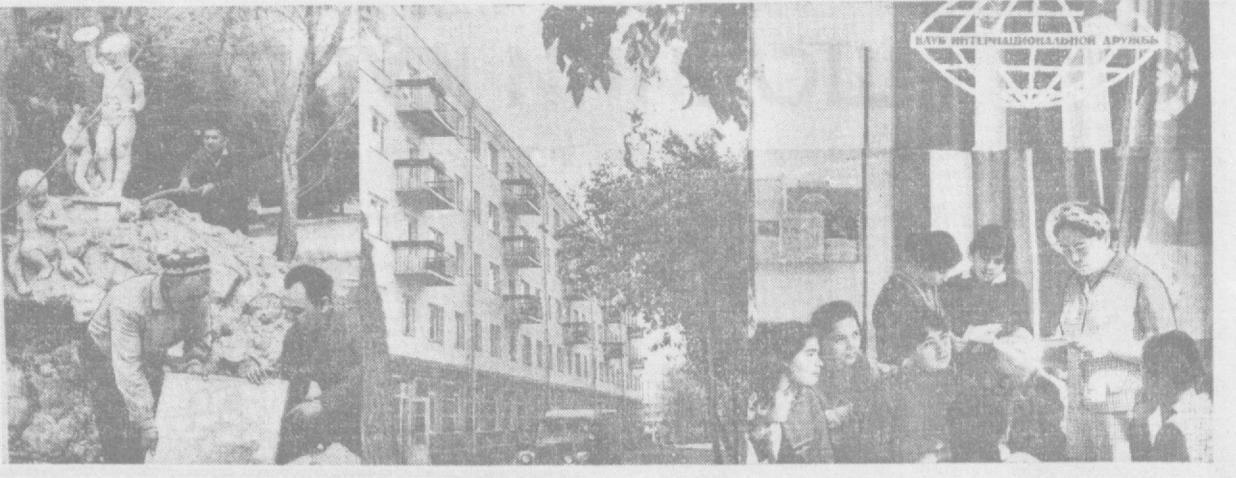
Суратларда: (чапда) Пушкин номли маданият ва истироҳат боғи ходимлари паркин мавсумга тайёрламоқдалар. Бу ерда сўнги ишлар бажарилаётган. Янги мавсумга янги фонга қурилади. В. И. Ленин бюсти ўрнатилди, эстрада театри қайтадан яхшиланди. (Ўртада) Луначарское шосседа 5 та кўп қаватли бино фойдаланишга топширилади. Сиз ана шу биноларнинг бирини кўриб турибсиз. (Чапда) Ленин номидаги пионерлар саройи ҳузурда «Интернационал дўстлик клуби» ишлаб турибди. Клуб аъзолари Руминия, Болгария, ГДР, Польша ва бошқа мамлакат пионерлари билан хат ёзиб туришди.