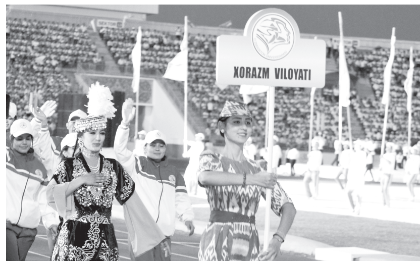
тизимдаги спорт ўйинларининг ҳам бош мезони ҳисобланади.

С. МАХСУМОВ, Н. СОБИРОВ, Х. ПАЙДОЕВ (суратлар), «Халқ сўзи» мухбирлари.