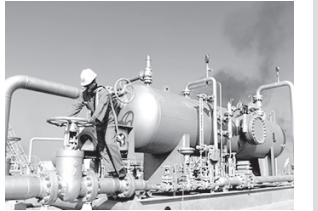
Белгиланган фьючерс шартномаларига кўра эса, "WTI" маркали углеводород хом ашёси бир баррелининг нархи 0,94 фоиз кўтарилиб, 49,56 долларга етган.

Бу ўтган йилнинг ноябрь ойидан бери кўзга ташланган энг юқори кўрсаткичдир. Мутахассисларнинг билдиришича, мазкур қиймат яна ошиши мумкин. Бунга «қора олтин» қазиб чиқаришнинг камайгани ва экспортлар АҚШда белгиланган кунлик захира миқдорини тахмин қилишда қарийб бир миллион баррелга адашшигани сабаб бўлгани айтилмоқда. Июль ойи учун