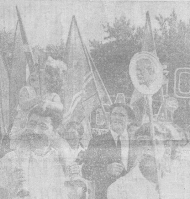
Тошкент. Меҳнаткашларнинг 1-Май даъвоишлари.

Мамлакатимиз меҳнаткашлари улуг айём—1 Майни қувонч билан байрам қилдилар. Совет халқи жонажон Коммунистик партиямизга содиқ эканлигини, марксизм-ленинизм ва пролетар интернационалиزمни гоғларини оғишмай амалга ошираётганлигини яна бир бор тантанали суратда намойиш қилди.