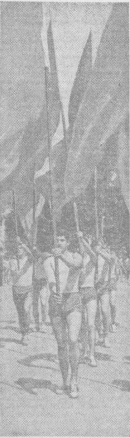
Спорт — ёшлик, гўзаллик, кучлилик деражидир. Пойтахтимизнинг ёш спортчилари 1-Май намоишида.