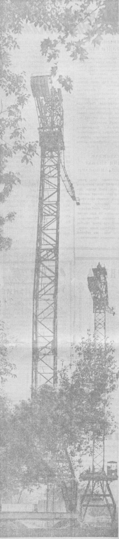
Серхуш республикамиз пойтахти Тошкентда қад қўраётган қўшпар биналарнинг сонини тобора кўпайиб бормоқда. Забарнаст техникалар эси қўрувчиларнинг оғирини енгил қилмоқда. Фотомухбирини А. Аббалининг ушбу суратида 70 метрли кўтарма кранини кўриб турибсиз. Унинг ердамида 19 қаватли маъмурий бино қурилади.

ЛОНДОН. Қуролланган таловчилар гуруҳиса 1 майда Лондонда олтин ортирган усти ёпиқ автомашинага ҳужум қилиб, 350 минг фунт стерлинг турвадиган қўйма олтинни ўғирлаган. Бу — Англия тарихидаги энг катта таловчиллик бўлиб, ҳеч қандай шунчалик кўп олтин ўғирланмаган эди. Лондон полицияси таловчиларни қидириб, топиш учун ошмиш чоралар қўрди.