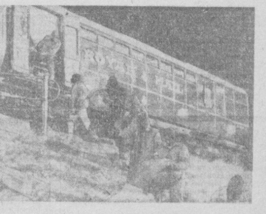
АНГЛИЯ. Ишга яроқсиз темир йўлларнинг бирини янги «Тўна» киносе суратга олишмоқда. Қачон лардир пошта поездада Англия банқасининг иккинчи йили миллионга яқин фунт стерлинг пули ўғирланган эди. Кинофильм ана шу воқеа ҳақида хикоя қиллади.

ВАШИНГТОН. АҚШда 1966 йилнинг охирида батамом ишсиз бўлган кишилар сонини 2,9 миллионга етган. Утган йил нисман ишсиз қилиб қийналган кишилар жами 10,5 миллионни ташкил этган. 16 ёшдан 19 ёшгача бўлган америкалик ешларнинг ўн икки проценти мамлакатда доимий иш топа олмастлар. Негр ешлари орасида бу процент икки баравар кўп. Бу рақамлар АҚШ президентининг мамлакатдаги ишчи кучининг аҳоли турғисида конгрессга илган докладда келтирилган.