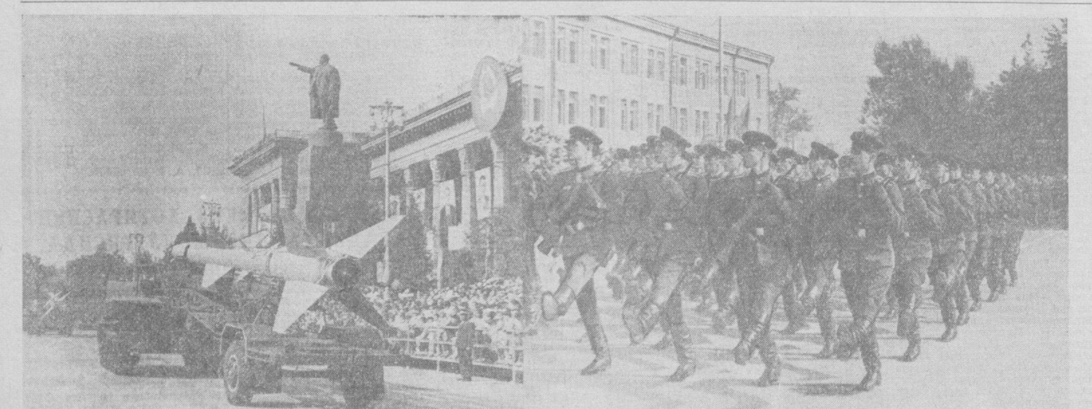
Тошкент. В. И. Ленин номидаги Қизил майдон. Ҳарбий паради.

Областимизнинг бошқа шаҳарлари Охангарон ва Янгибобода ҳам байрам намойишлари катта уюшқоқлик билан ўтди.