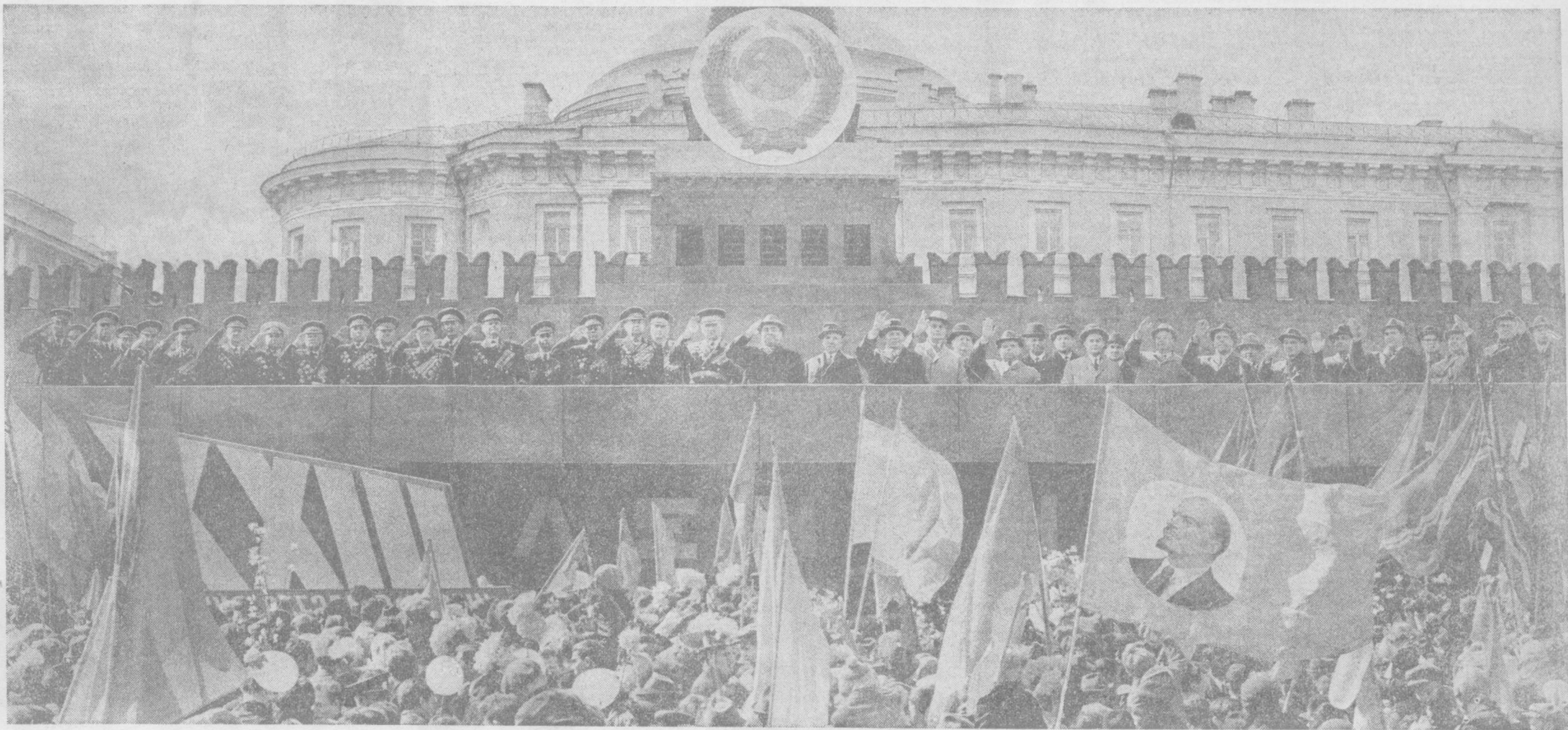
МОСКВА МЕХНАТКАШЛАРИНИНГ 1967 ЙИЛ 1 МАЙ НАМОЙИШИ