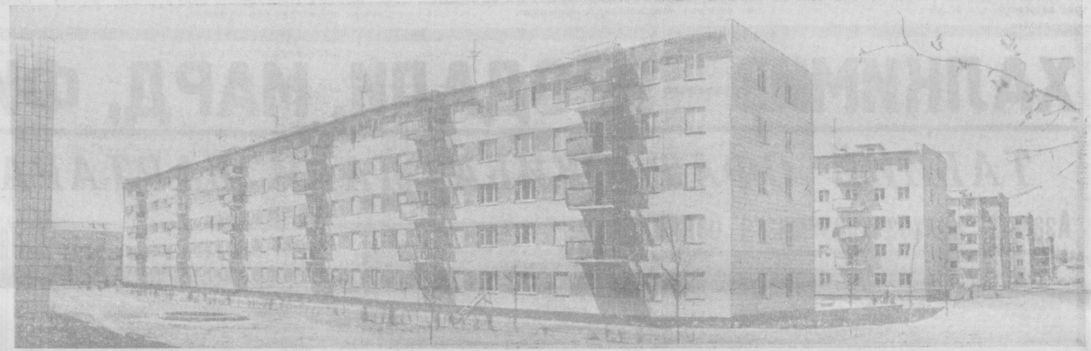
Сиз суратда кўриб турган бу уйлари Чилонзорда Ужўена бино корлари бунёд этилган.

қилиш ва клиника практикисини қўлаб олиш тавсиси экинчи бўлиб шугулланган янги лаборатория олдида асосий вазифалардан бири қилиб қўйилди. — дейди кафедра ассистенти ўртоқ У. Нудомов. — Фақат шу ишлар билангина чекланиб қолмаймиз, албатта. Иккидэй фаолият доирасини кенгайтириш йўлида шу мавзу билан боғлиқ яна бир қатор муаммолар устида ҳам тадқиқотлар амалга оширилади. Овнат ҳам қилиш органлари физиологияси ва патологиясини ўрганишга алоҳида аҳамият берилади. Сизга айтсам, ошқозон-ичак тракти физиологиясининг ўзи катта бир соҳа. Бу масала билан шуғулланганда қўл урилган экан, қатор амалий тажрибалар ўтказишга тўғри келади. Бунда радиотелеметрия усулидан кенг фойдаланиш жуда қўл келади. Лаборатория бу мураккаб усулдан мамлакатимизда биринчилар қаторида фойдаланишига киришди. Қўнғи яқин, эса қолади деганларидек, лабораториядаги иш жараянини қузатишга тўғри келиди. Радиотелеметрия усули қўллаш учун бир неча аппаратлар ишга солинди. Лабораторияга ўрнатилган чала ўтказилган радиотрибунини орқали бемор қон босими, ошқозон ширасининг тарини ва ҳарорати эшиттириб турилди. Радиотелеметрия эса айни бир вақтда ошқозондаги содир бўлаётган ўзгаришларни диаграмма дегансига ёзиб боради. Олинган маълумотлар касаликка аниқ диагноз қўйиш имконини бериди. Мураккаб медицина асбоб-ускуналари билан ижроланганлиги, энг муҳими улар шончилиқ қўлларга топириб қўйилганлиги лаборатория муваффақиятини таъминлайдиган муҳим омил бўлиб хизмат қилади. А. АЛИЕВ.