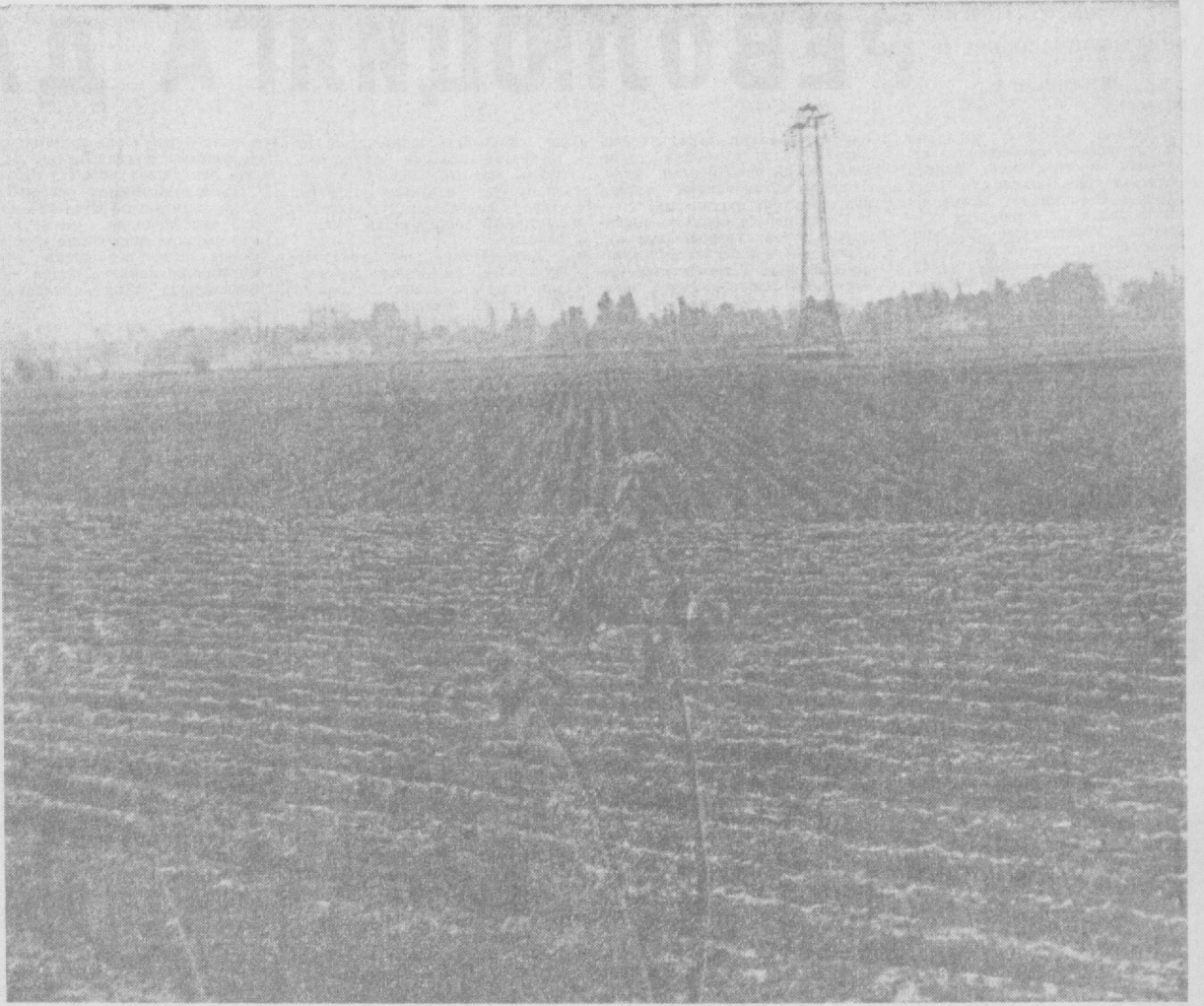
Мул ҳосилдан дарак берувчи яшил кўчатлар поёнсиз пахтазорлар узра барқ уриб ўсмоқда. Суратда: Урта Чирчиқ райони колхозлари даладан бир кўриниш.

Карлови Вари конференцияси Европа марксиз-ленинча партияларининг пролетар интернационализмий гояларига содиқлигини, тинчлик, демократия, миллий мустақиллик ва социализм иши учун империализмининг агрессия ва реакцион сиёсатига қарши курашда замонавий революцион кучлари иттифоқини мустаҳкамлашга улар нитқлабганлигини кўрсатувчи янги далил бўлди. Конференция қабул қилган ҳужжатларда, қардош партия вакилларининг нутқларида, Американинги Вьетнамдаги агрессиясига ва Грециядаги ҳарбий тўнтаришга қарши қаратилган баёнотларда бу нарса ўз ифодасини топди. КПСС делегациясининг ҳисоботи муҳокама қилинганда Карлови Варидаги конференция — социалистик мамлакатлардаги жамиятга давлат раҳбарлигини амалга ошираётган, шунингдек капиталистик давлатларда ишчилар синфининг иши учун кураш олиб бораётган Европа коммунистик партияларининг тарихда биринчи учрашуви бўлганлиги алоҳида таъкидлаб ўтилди. Конференциянинг муваффақияти марксиз-ленинча партияларнинг бирга ҳаракат қилиши ҳаётий зарур эканлигини, коммунистик ҳаракатнинг келишиб олинган йўлини ишлаб чиқиш учун, унинг жинслигини мустаҳкамлаш учун коллектив учрашув ва кенгашлар фойдали эканлигини яна бир марта исбот этди. КПСС Марказий Комитетининг Сиёсий Бюроси КПСС делегациясининг Карлови Вари конференциясидаги фаолиятини маъқуллаб, конференция ҳужжатларини кенг пропанда қилиш ва ундаги таъсияларни амалга ошириш учун барча зарур чоралар кўришни КПСС Марказий Комитети секретариати ва тегишли ташкилотларга топширди.