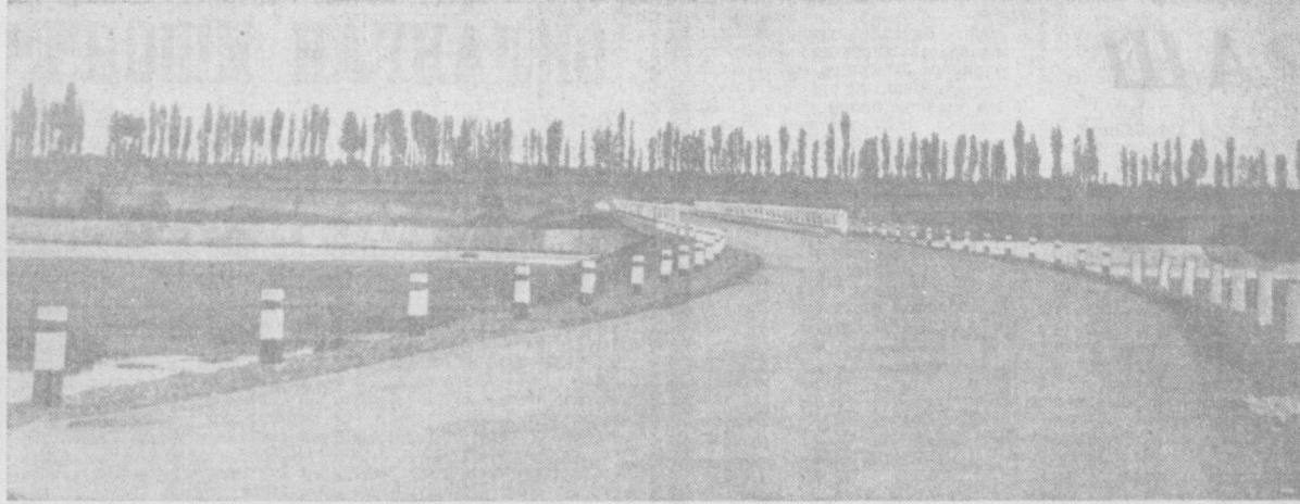
ЙУЛЛАР, РАВОН ЙУЛЛАР...