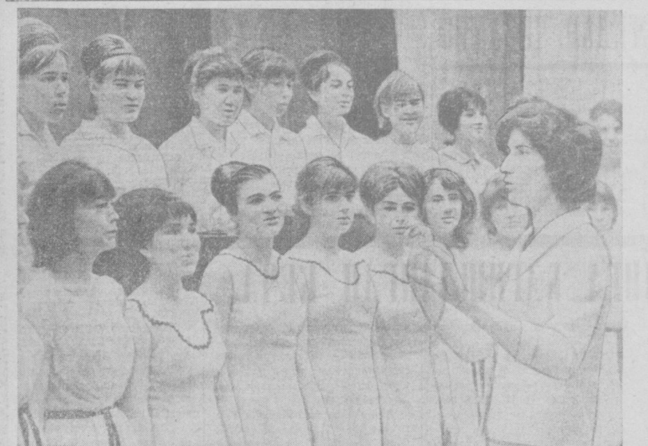
Сават хаваскорларининг область фестивали давом этмоқда. Яқинда Чирчиқда шаҳар бадий хаваскорларининг область фестивали бўлиб ўтди. Фестивалда Чирчиқ шаҳрининг жуда кўп бадий хаваскорлик коллективлари иштирок этди. Унда пойафзалчилар клуби бадий хаваскорларининг чиқишлари айниқса катта оққишга сазовор бўлди. Сурагда: пойафзалчилар клуби хор коллективи кўнқ ажро этмоқда.

лаини асосида ташкил этилган, уларнинг тасвиси билан қурилган йирик қорхонадир. Беш йиллик давомида Тошкент областида турли хил товланувчи пардозлаш тошлари қазиб чиқариш бўйича бир қанча йирик қарьерлар бунёд этилди. Келас йили Бўстонликда йирик мармар заводи қурилиши бошланади. Унга хомаёш Газаленгиди мармар қарьеридан етказиб турилади. Геолог ва бинокорларнинг алоқаси йилдан-йилга мустаҳкамланапти. Бу қурувчилар олдида турган ушан ва масъулиятли вазифаларнинг муваффақиятли бақарилиши, бинокорларнинг сифатли қурилиш, қурилишнинг ошширишга беқисс ёрдам беради. Геологлар қурилиш материалларини қидириб топиш ва уларни капитал қурилиш манфаатларига хизмат қилдириш йўлида бундан буён ҳам кенг қўлама изланиш олиб бораверадилар. И. АХМЕТОВ.