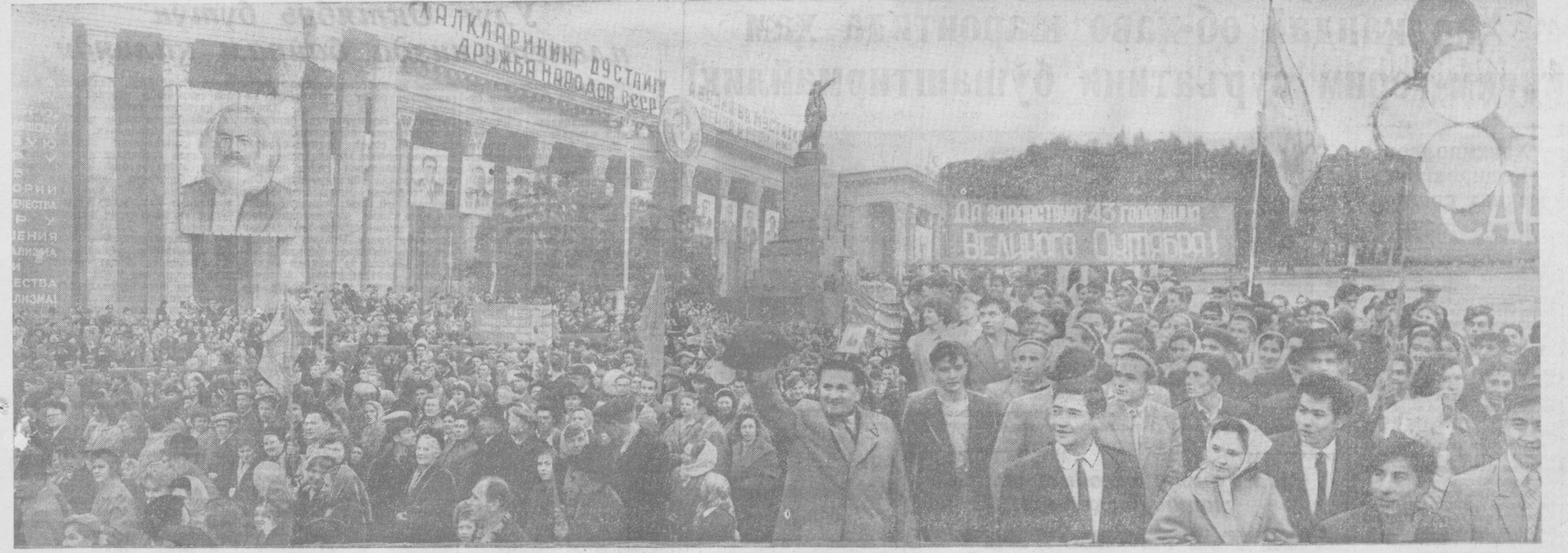
Тошкентда меҳнатчиларнинг байрам намойиши.