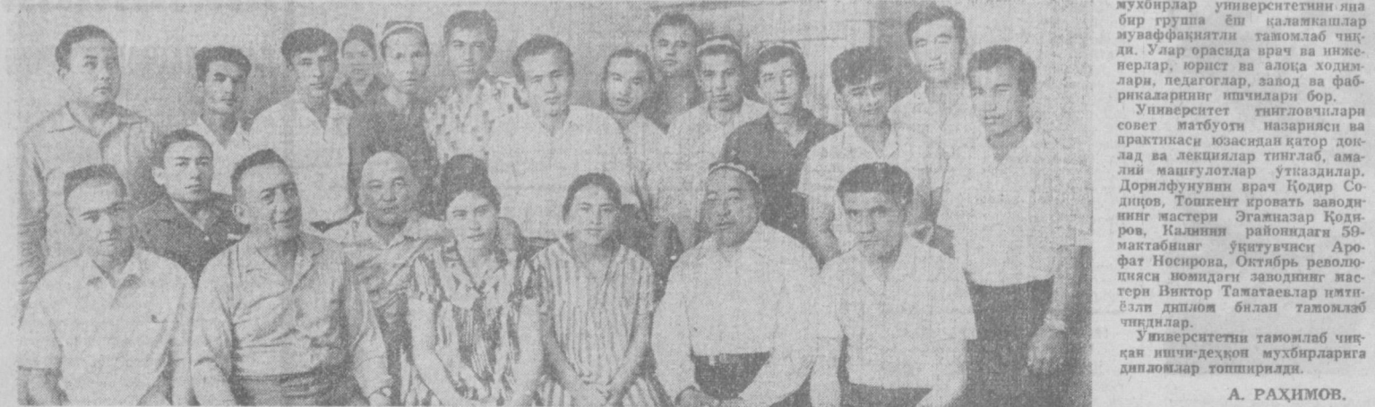
Суратда: Ишчи-мухбирлар унверситетининг битирганлардан бир гуруҳи.