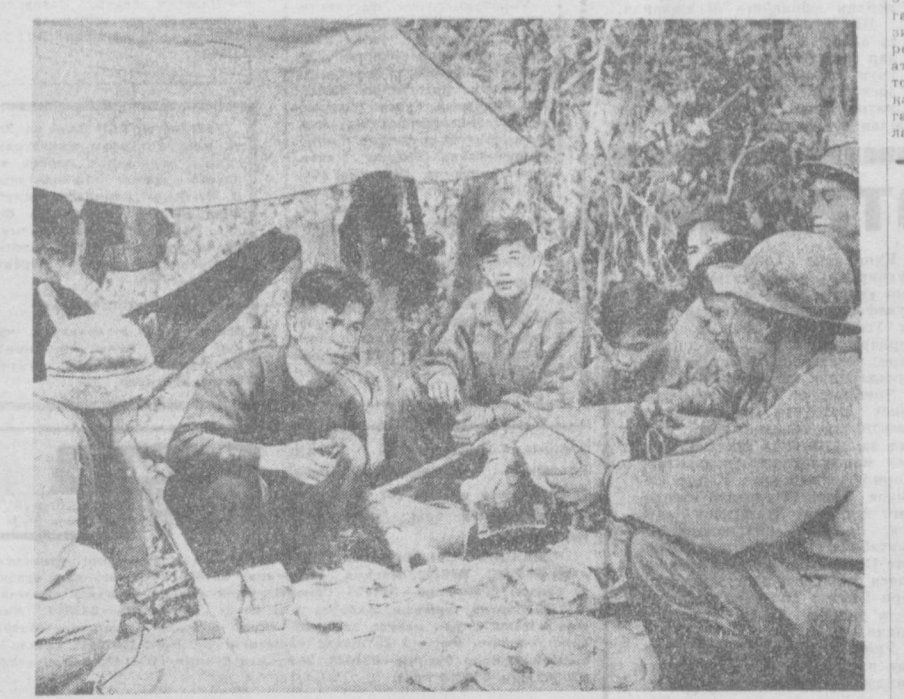
ЖАНУБИЙ ВЬЕТНАМ. Озодлик армияси жангчилари навбатдаги жангдан сўнг дам олишяпти.