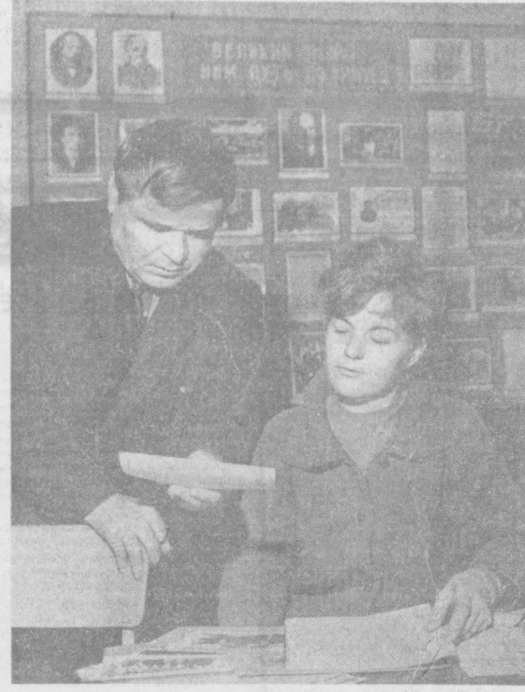
Русдан Т.ЎҚИН таржималари.

Баҳорнинг бир куни йилда туяди, Ораниб кутганим — сен билан висол, Сенинг кўлларинга кўнглим қуюлди,