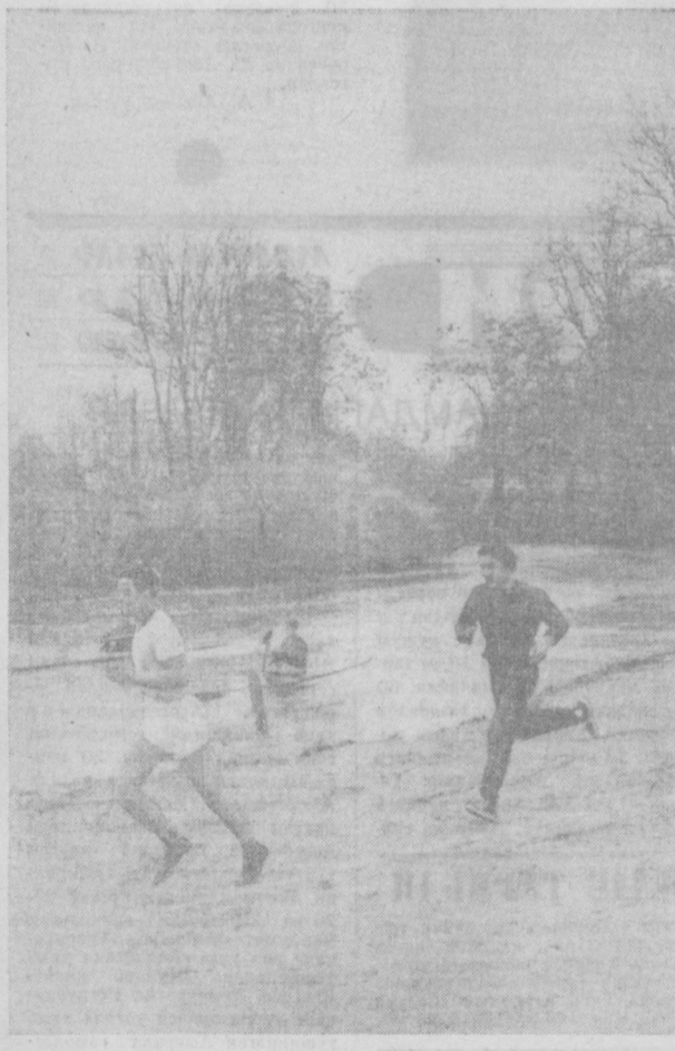
Суратда: спортчилар Андор бўйида машқ қилмоқдалар.