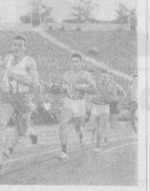
Энг кучли югурувчилар 800 метр масофага йўғи қилишмоқда.