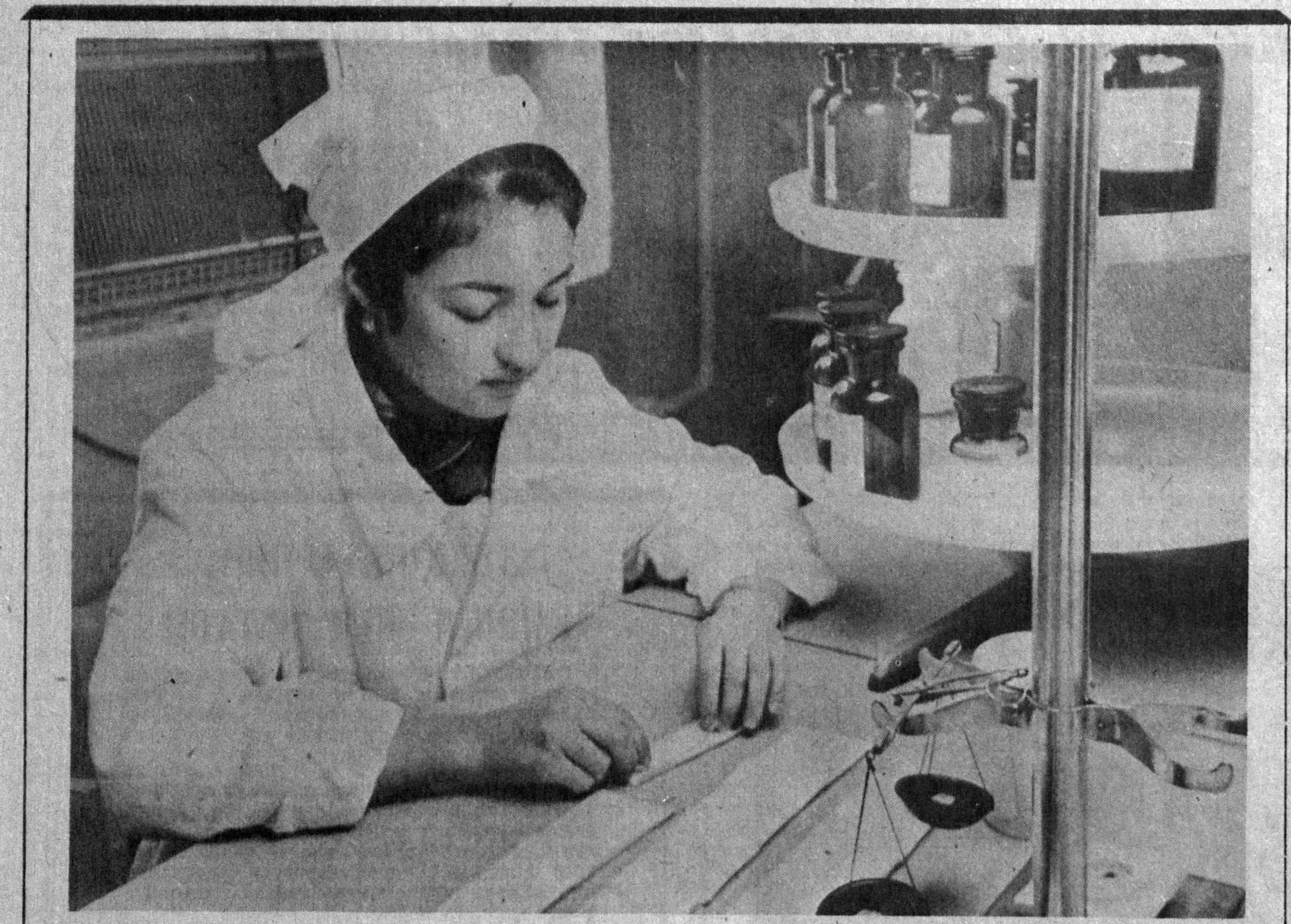
Сибё ноҳиясидаги дори-дармон ишлаб чиқариш корхонасининг 1977 дорихонаси вилоятда янги ҳисобланади. Бу дорихона 20 дан ортқ касалхоналарни ининкция учун ишлатиладиган дорилар билан узлуксиз таъминлаб тура-