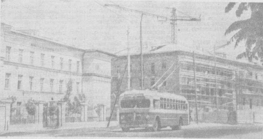
Суратда: Ново-Московская кўчаси.