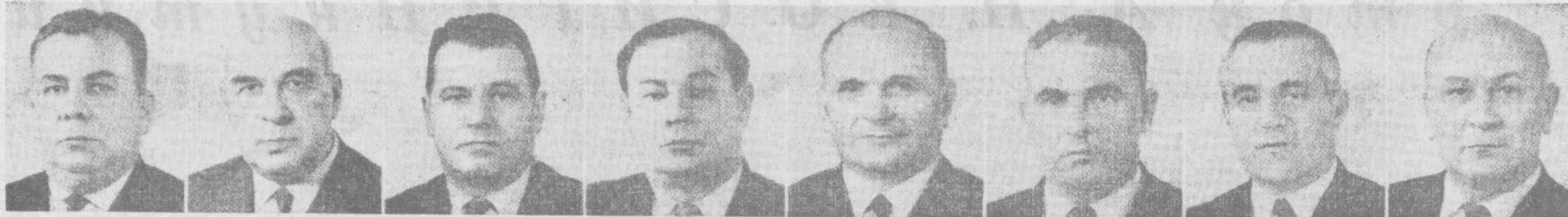
И. Ф. СИННИЦИН. СССР трактор ва қишлоқ хўжалик машинасозлиги министри.