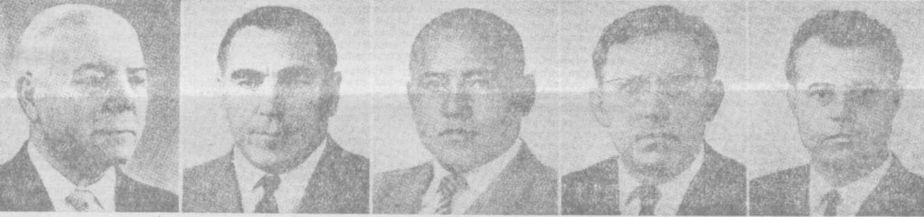
К. Е. ВОРОШИЛОВ. СССР Олий Совети Президиумининг аъзоси.