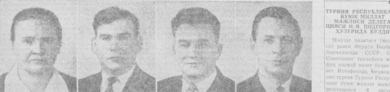
А. И. КАСАТКИНА. СССР Олий Совети Президиумининг аъзоси.