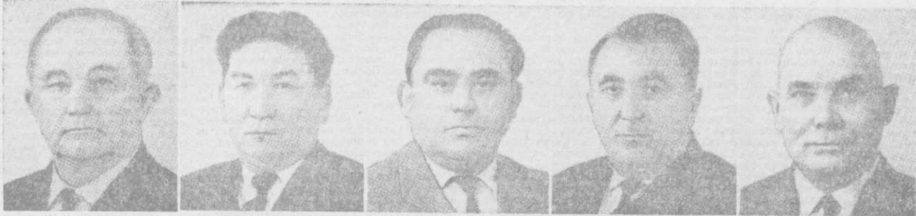
Я. Э. КАЛНБЕРЗИН. СССР Олий Совети Президиуми Раисининг ўринбосари.