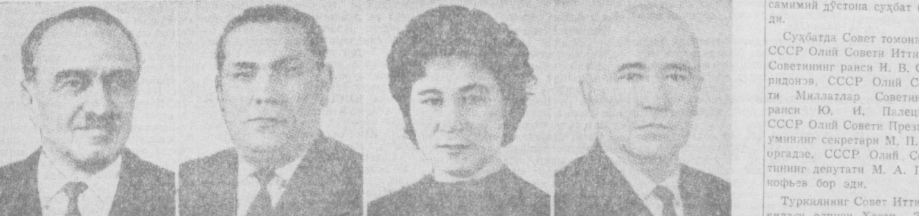
А. Н. МИКОЯН. СССР Олий Совети Президиумининг аъзоси.