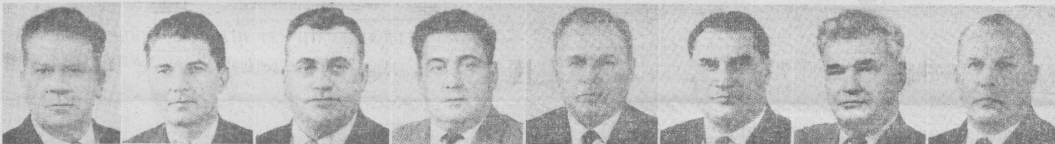
А. И. СТРУЕВ. СССР савдо министри.