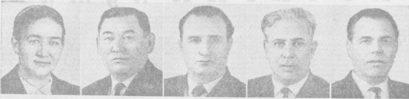
Е. С. НАСРИДИНОВА. СССР Олий Совети Президиуми Раисининг ўринбосари.