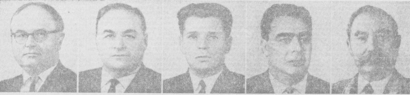
А. А. МЮРСЕИ. СССР Олий Совети Президиуми Раисининг ўринбосари.