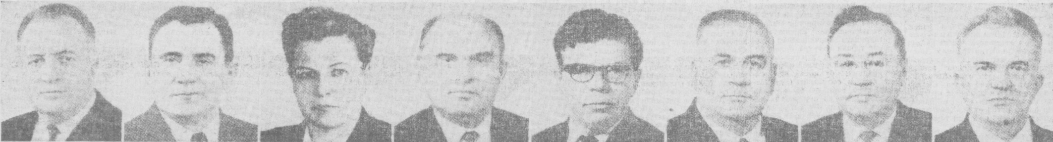
Б. В. ПЕТРОВСКИЙ. СССР соғлиқни сақлаш министри.