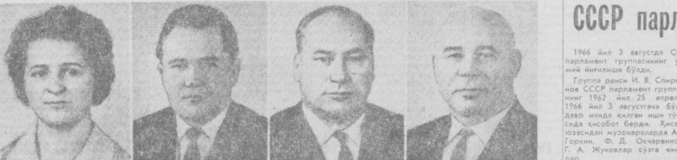
З. П. ПУХОВА. СССР Олий Совети Президиумининг аъзоси.