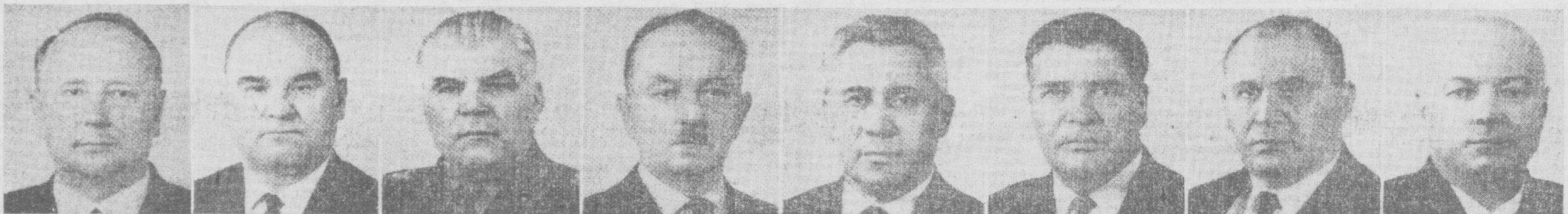
В. Д. ШАШИН. СССР нефть чиқариш саноати министри.