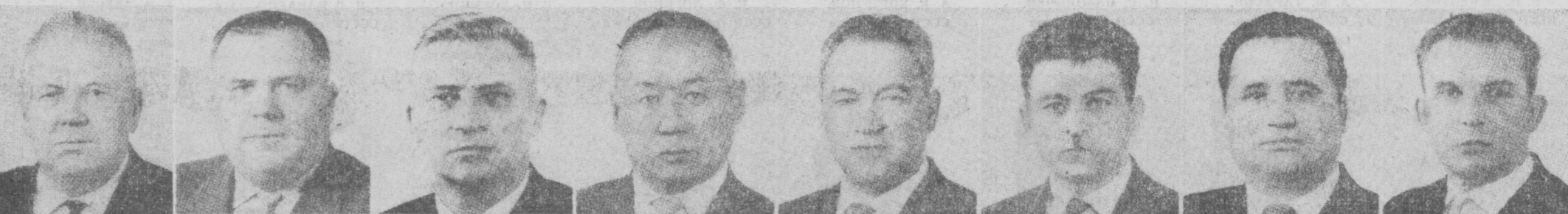
М. Ю. ШУМАУСКАС. Литва ССР Министрлар Советининг Раиси.