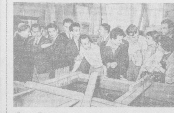
Яқинда Тунис студентларидан бир гуруҳи Ўзбекистонга меҳмон бўлиб келишди. Суратда: Тунис студентлари ўрта осий ирригация илмий-тежирини институтининг гидротехника лабораториясида.