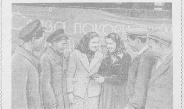
22 октябрь куни Тошкентдаги Горький номида театр биносига партия ва ҳуқуқатнинг чадирини жаваб Мирзачўлнинг қўриқ ерларини ўзлаштиришга бoриш учун комсомол шувекасини олган комсомол-ешлар тўлақиллар. Бу ерда ватанпарвар ешларни кузатув маросими бўлди.