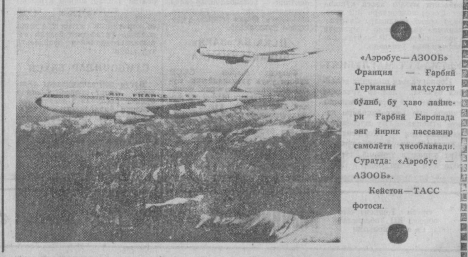
«Аэробус—АЗООб» Франция — Ғарбий Германия маҳсулотидир бўлиб, бу ҳаво лайнери Ғарбий Европада энг йирик пассажир самолёти ҳисобланади. Суратда: «Аэробус — АЗООб».

сиб олганлигининг тўрт йиллиги байрам қилинадиган кунларидан ана шу виллоят марказининг қўлдан кетиши Лон Нол режими мининг оубреига жуда катта зарба бўлиб тушди. Лон Нол авиациясининг ана шу қўшинлар мушкуллини осон қилиш йўлидаги уринишлари натижа бермади. Қўршаб олинган гуруҳга парашютлардан ташланган ҳарбий юкларининг талайгина қисми халқ қуроли нучларини қўлга ўтди.