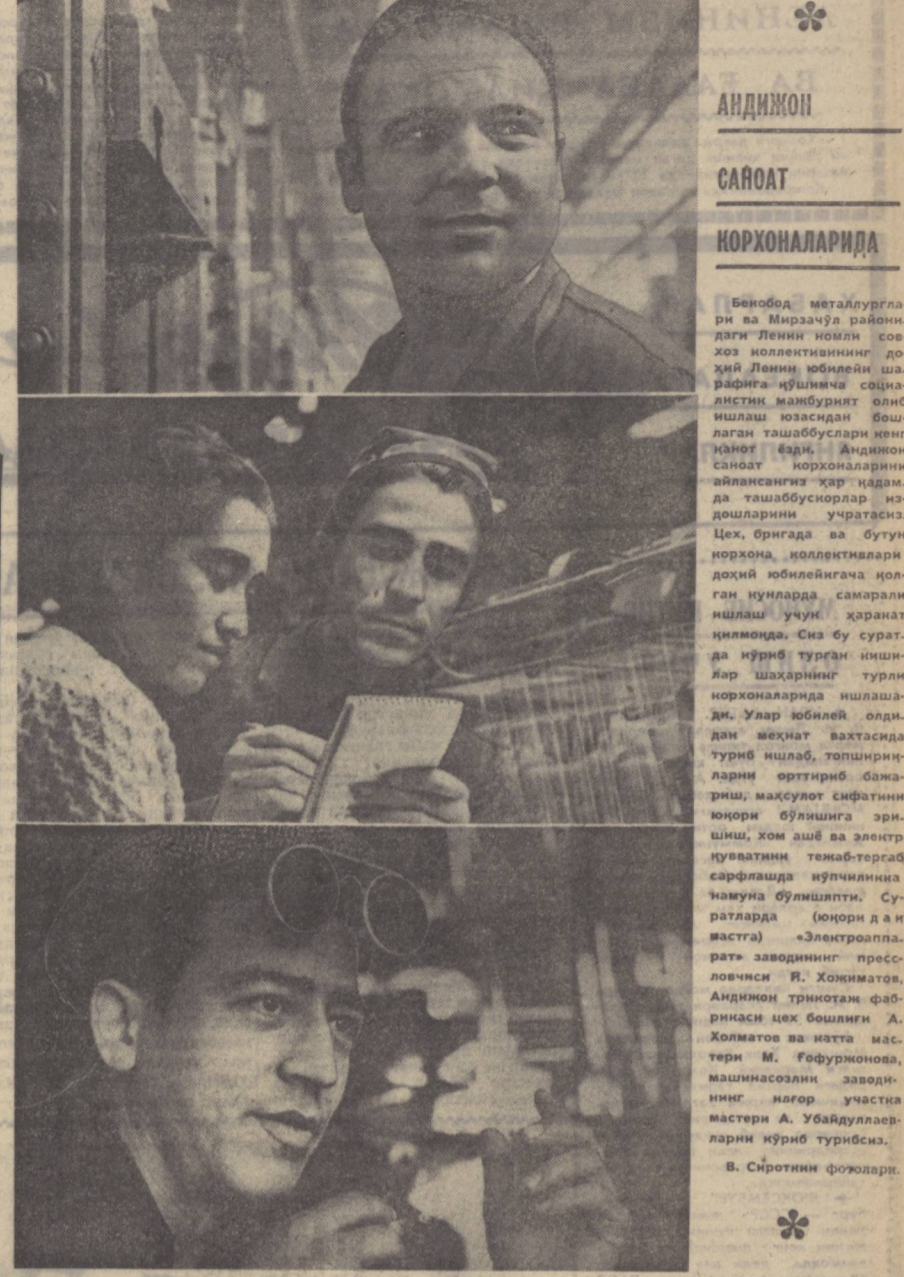
АНДИЖОН САНОАТ КОРХОНАЛАРИДА

ҳим омили — минерал ўғитни ҳеч қандай билмаган. Деҳқончилик маданияти туфан бўлиши тугаллаб ҳосилдорлик даст эди, бир гектар, яъни беш ярим таноб ердан ўртача 7-8 центнердан пахта олиниган.