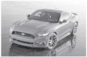
томонидан харид қилинган.

Мазкур жадвалда биринчи ўрин икки эшикли "Ford Mustang" моделига насиб этди. Бу ҳақда "IHS Automotive" манбаси хабар берди.