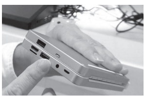
улана олади. Мазкур технологик воситага 32/64 гигабайтли флеш карта ўрнатиш мумкин.

"KB2" деб номланган мазкур қурилма "Windows 10 Home" операцион тизимида ишлайди. У 4 ядроли процессор, 2/4 гигабайтли оператив хотирага эга бўлиб, "USB 2.0", "Bluetooth", "WiFi" каби симли ҳамда симсиз интерфейслар тўпламига