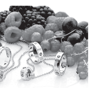
Хориж матбуоти хабарлари асосида тайёрланди.

Конфет, обакидандон, музқаймоқ кўринишидаги аксессуарлар оқ ва сариқ тилла, ёқут, аметист каби ноёб тошлар билан зийнатланган.