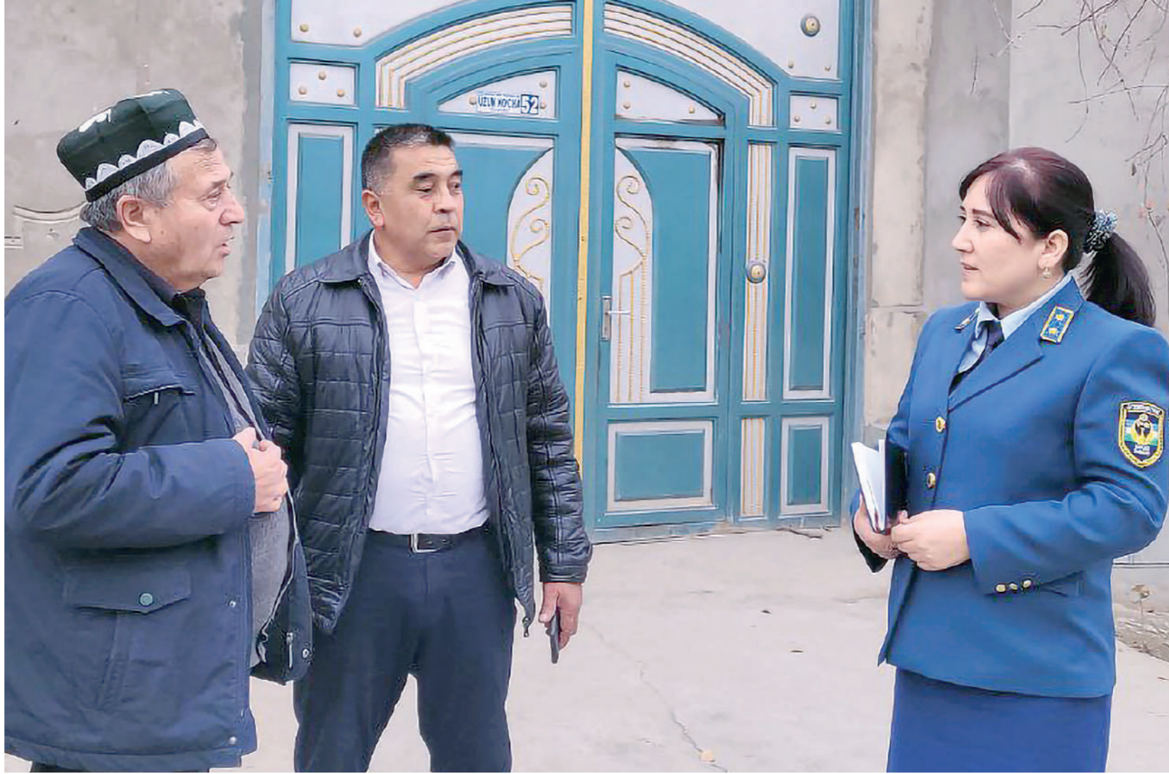
Фуқароларни ҳалол бизнесга жалб қилиш орқали солиқ тўловчилар сафини янада кенгайтиришни мақсад қилганман.

Бугунги кунда Наманган туманидаги 53 та маҳаллада 22 нафар солиқ инспектори 21 та йўналиш бўйича фаолият олиб бормоқда. Ўзим 546 та хонадон, 2 900 нафар аҳолига эга "Яшнобод" маҳалласига бириктирилганман. Бу ерда 545 та ер ва мол-мулк солиқ тўловчиси ва 15 та тадбиркорлик субъекти бор. "Солиқчи-кўмакчи" тамойили асосида ҳар бир солиқ тўловчига солиқ тўловларининг ўз вақтида тўланиши давлат бюджетини тўлдиршида муҳим омил эканини тушунтириб, маҳалламда инсофли солиқ тўловчилар кўпайишига ҳаракат қилинман. Бу йўналишда маҳалла раиси ҳамда ҳоким ёрдамчиси асосий кўмакдош. Маҳаллада жорий йилнинг январь-февраль ойларида 15