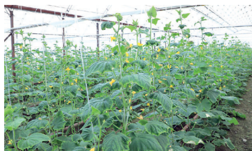
ИССИҚХОНАДА БОДРИНГ ПАРВАРИШЛАШ.

Кузда 10 сотих томорқага экилган саримсоқдан май-июнь ойига келиб, 1-1,2 тонна ҳосил олинади. Куз ойларида унинг жойига бошқа турдаги экин экиб, кўшимча даромадга эга бўлиш