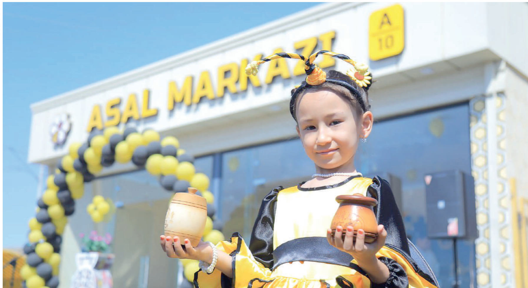
ИЖТИМОЙ ҲИМОЯГА МУҲТОЖ ОИЛАЛАРГА 1000 КГ. АСАЛ БЕПУЛ ТАРҚАТИЛДИ.