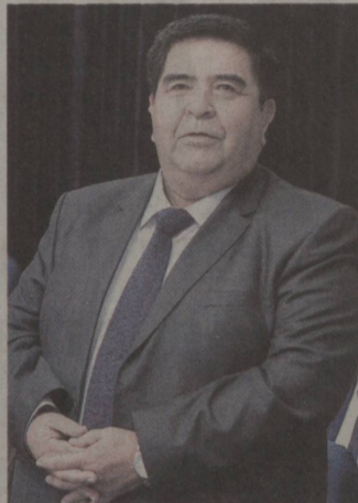
жамоаси ҳам иштирок этиб, ғолиблар қаторидан ўрин олди.

эти. Бутун дунёдаги эпидемиологик вазият инobatга олиниб, бу олимпиада ҳам онлайн (масофавий) тарзда ўтказилди. Унда Австрия, Саудия Арабистони, Озарбайжон, Македония, Арманистон, Исроил, Беларусь, Венгрия, Болгария, Сурия, Грузия, Латвия, Эрон, Литва, Туркия, Россия каби дунёнинг 20 дан ортиқ мамлакат и ёшлари масофадан туриб иштирок этди. Кимёвий тажрибаларисиз иккита назарий босқич тартибда ўтказилган мазкур халқаро Менделеев олимпиадасида юртимиз академик лицейи ва мактаб ўқувчиларидан иборат Ўзбекистон