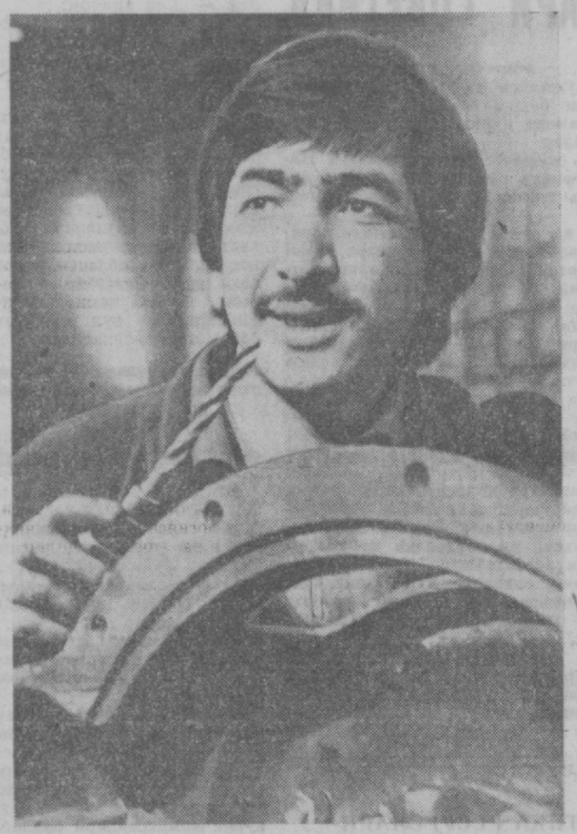
ТОШКЕНТДАГИ компрессор заводда «СССР 60 йиллигига 60 зарбдор ҳафта» шiori остида ўтказилаётган мусобақа тобора авж олмақда...