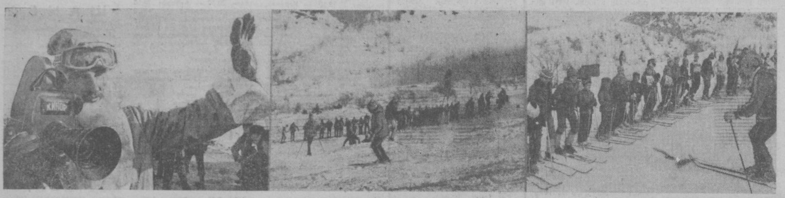
ХАР шайба, яқинлаб кунлари Чимён туристик базаси Тошкенга ва областимиз шаҳарлари меҳнатшўнашлари билан гажум бўлади. Улар бу ерда ўз саломатликлари мустаҳкамлайдилар.

Чимён қадимдан 12 булоғи билан машҳур. Ҳозир бу булоғлар бирлаштириб юборилган.