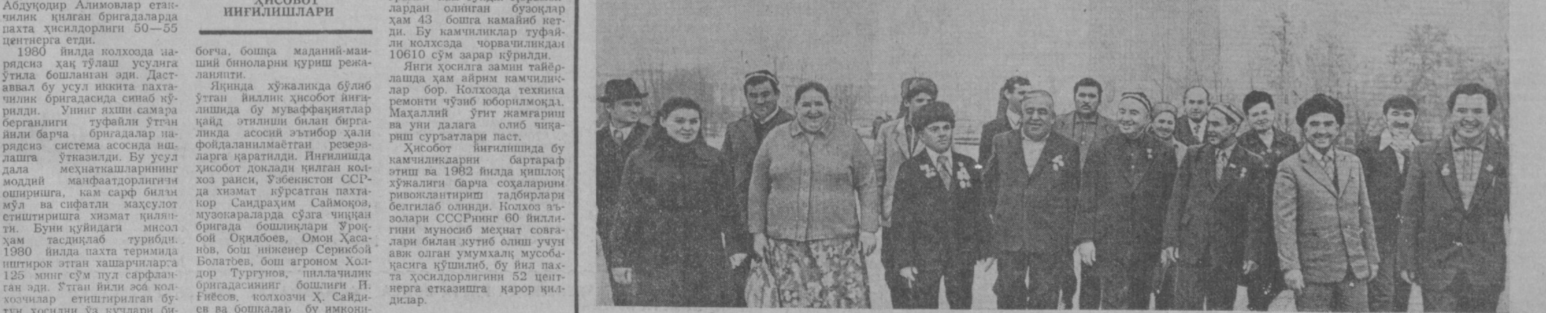
Суратда: Тошкент область касабасоюзлари XI-союзларарао конференцияси делегатларидан-бир-группаси.