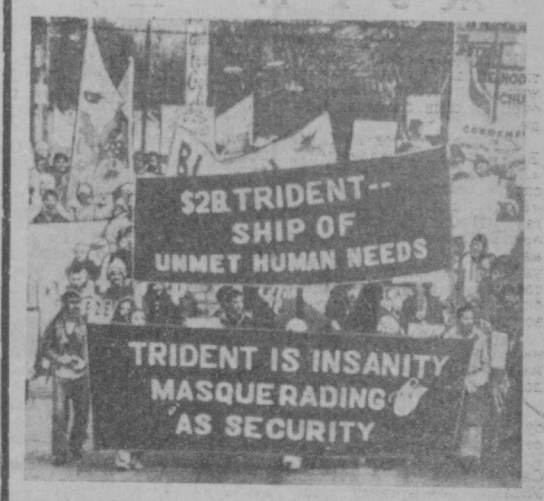
Америка Қўшма Штатларида Оқ уй маъмуриятининг милитаристик йўлга қарши норозилиқ кўчлиб борапти. Сурагда: Конектикаут штатидagi Гротон шаҳрида 10-ини ўтказилди. Бу ерда ҳарбий деиши флотига «Трайденд» программаси бўйича биринчи «Огайо» атом сувоиси кемасининг берилиш жамоатчилиги норозилиги сабабчи бўлди.

★ ТЕХРОН. «Иттилоат» газетасининг хабар беришича, Мараг, Табрис, Дифула, Тоникабом ва Қучан шаҳарларида ҳукуматга қарши ташиқлотларнинг аъзолари ва тарофдорлардан яна 19 киши қатл этилган. Уларнинг ҳаммаси Эрондаги мажмуи режимни ағдариб ташлаш мақсадига қуроли кураш олиб боришга айлангади. ★ КОБУЛ. Афғонистоннинг шимолидаги Жузукон вилоятида яна бешта саводсизликни тугатиш кураши очилди. Бу курашларда халқ милициясининг ҳодимлари, уриш ва ёшини ўрганадилар. Саводсизликка қарши кураш-ён республика олдидан турган ва Афғонистоннинг катта ёшлаган бутун аҳолисига қараб олиш лозим бўлган асосий вазифалардан биридир. Ҳозирги вақтда мамлакатда 23 миңдан зиёд кураш ишлаб турипти. Бу курашларда ишчилар, деҳқон-