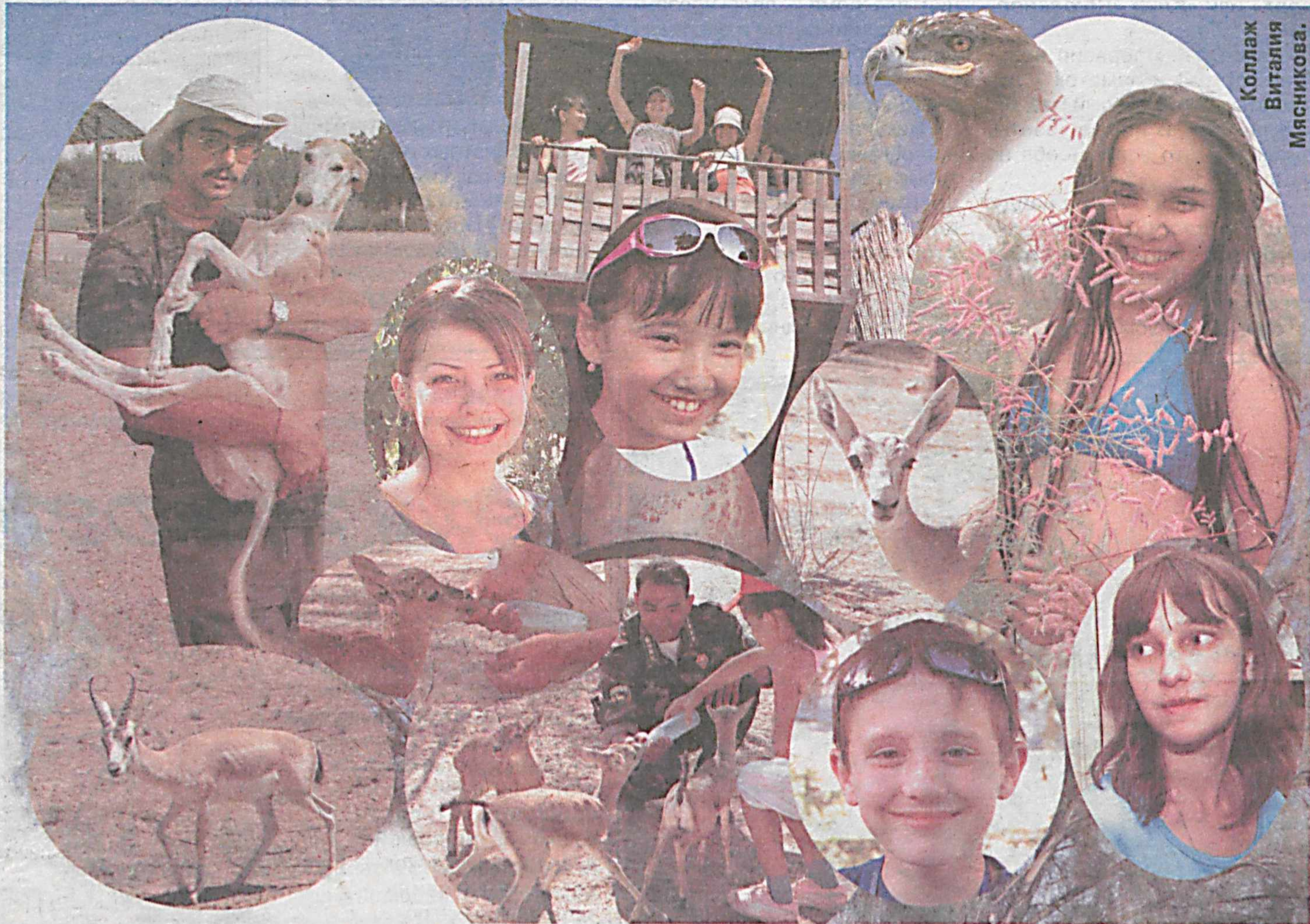
Коллаж Виталия Мясникова.

ИДУ К ВОЛЬЕРУ. Над головой чистое-чистое, голубое-голубое небо, а под ногами горячий песок, на котором оставили следы сороконожка, мышка-песчанка, тушканчик и многие-многие другие. Ведь эта природная зона - родной дом 31 вида млекопитающих, 208 видов птиц и 18 видов рептилий. Почти дошли. Волнуюсь. Ведь джейраны - животные пугливые, но один из самых опытных со-