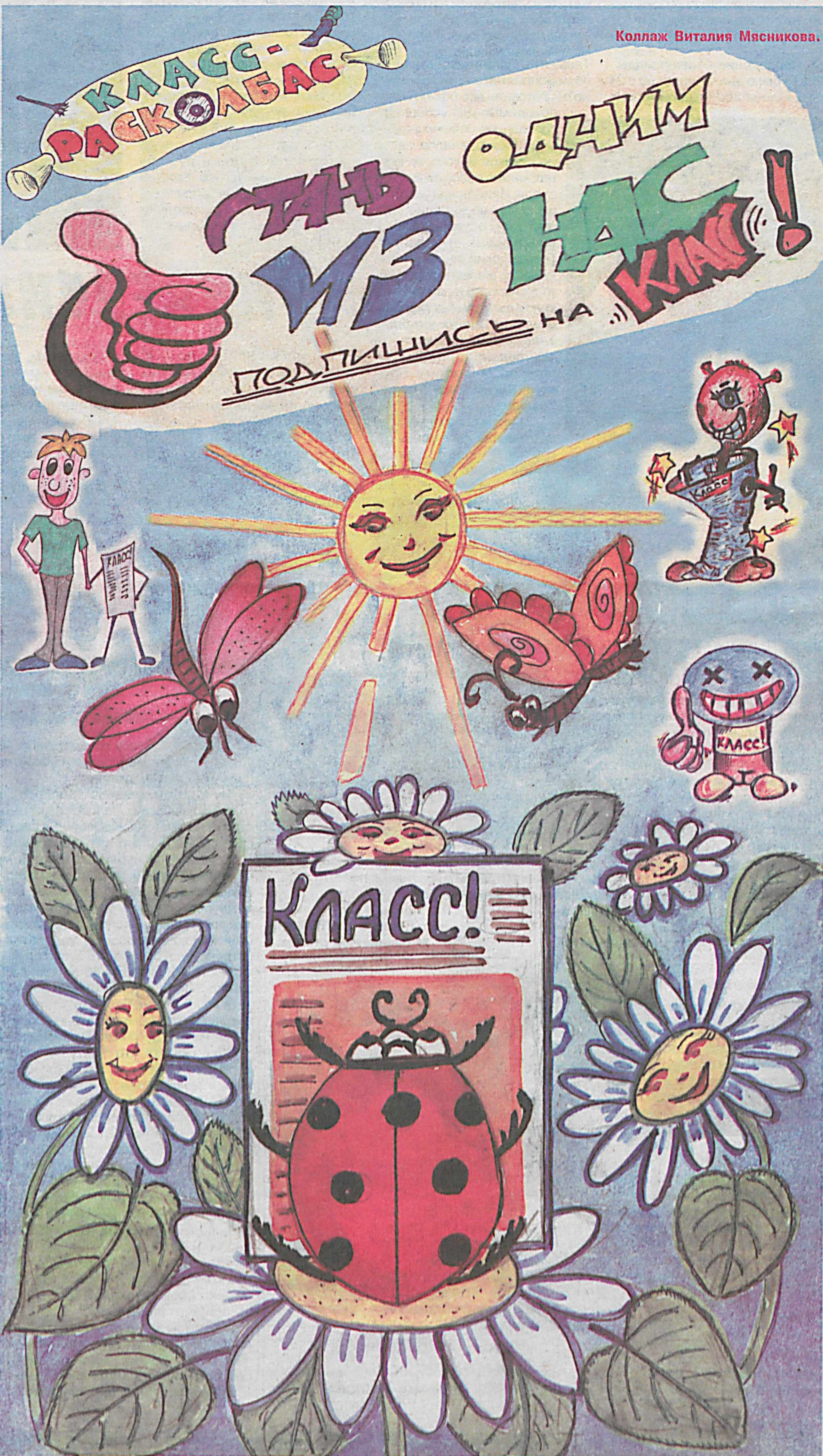
Коллаж Виталия Мясникова.