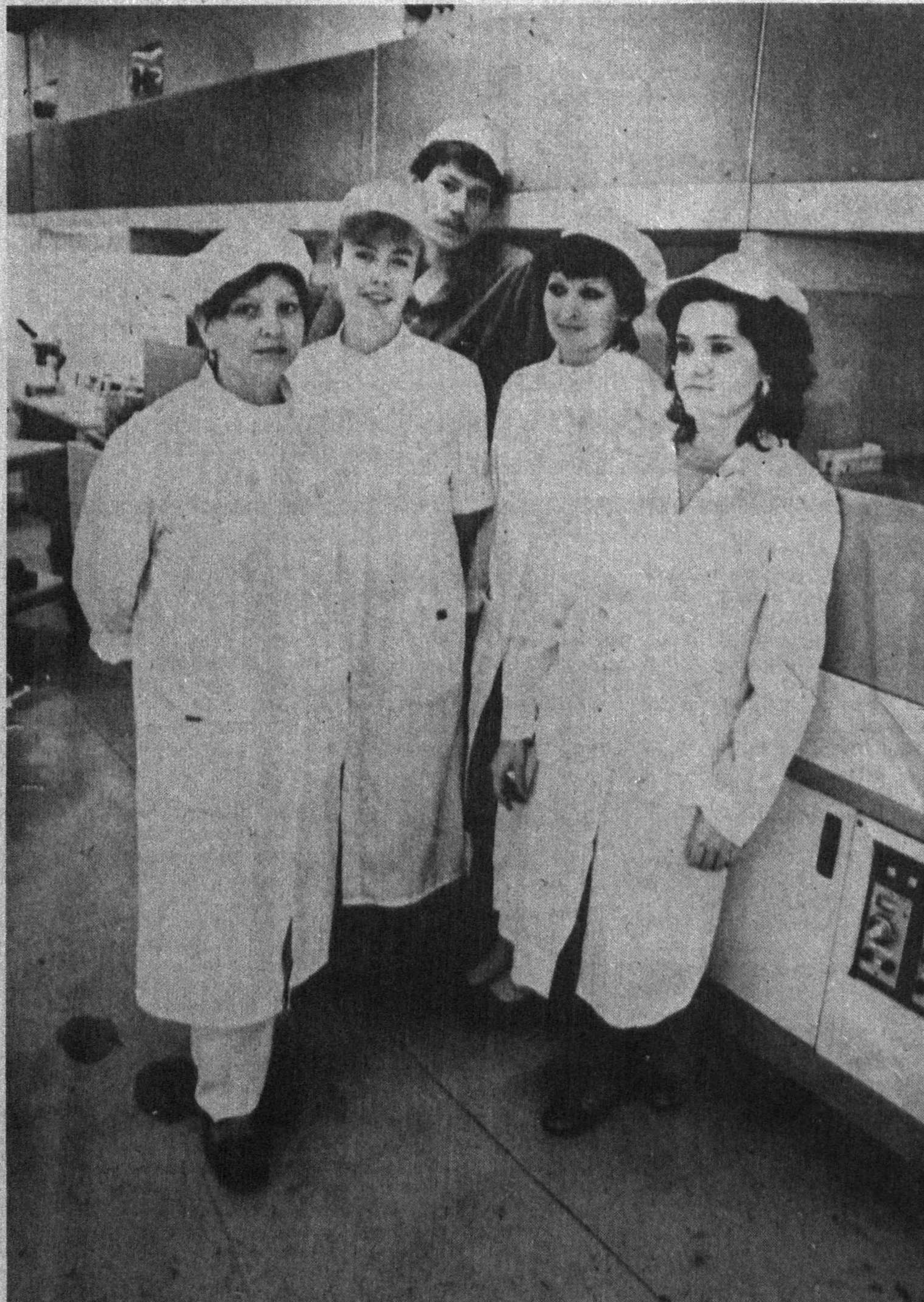
Бозор иқтисодиётига ўтишда қўдратли завод-фабрикалар жуда ҳам керак. Қонаверса мавзуд шиллаб чиқариш корхоналарини мустахкамламас эканмиз бу янгича иқтисодий жараёнда бой бериб қўйишимиз мумкин. Қисқаси янгисига қўрибниз етмасиз илгариларидан унумли фойдаланишимизда ҳам гап қўнда. Тошкент «Зенит» заводи ўзбекистон...