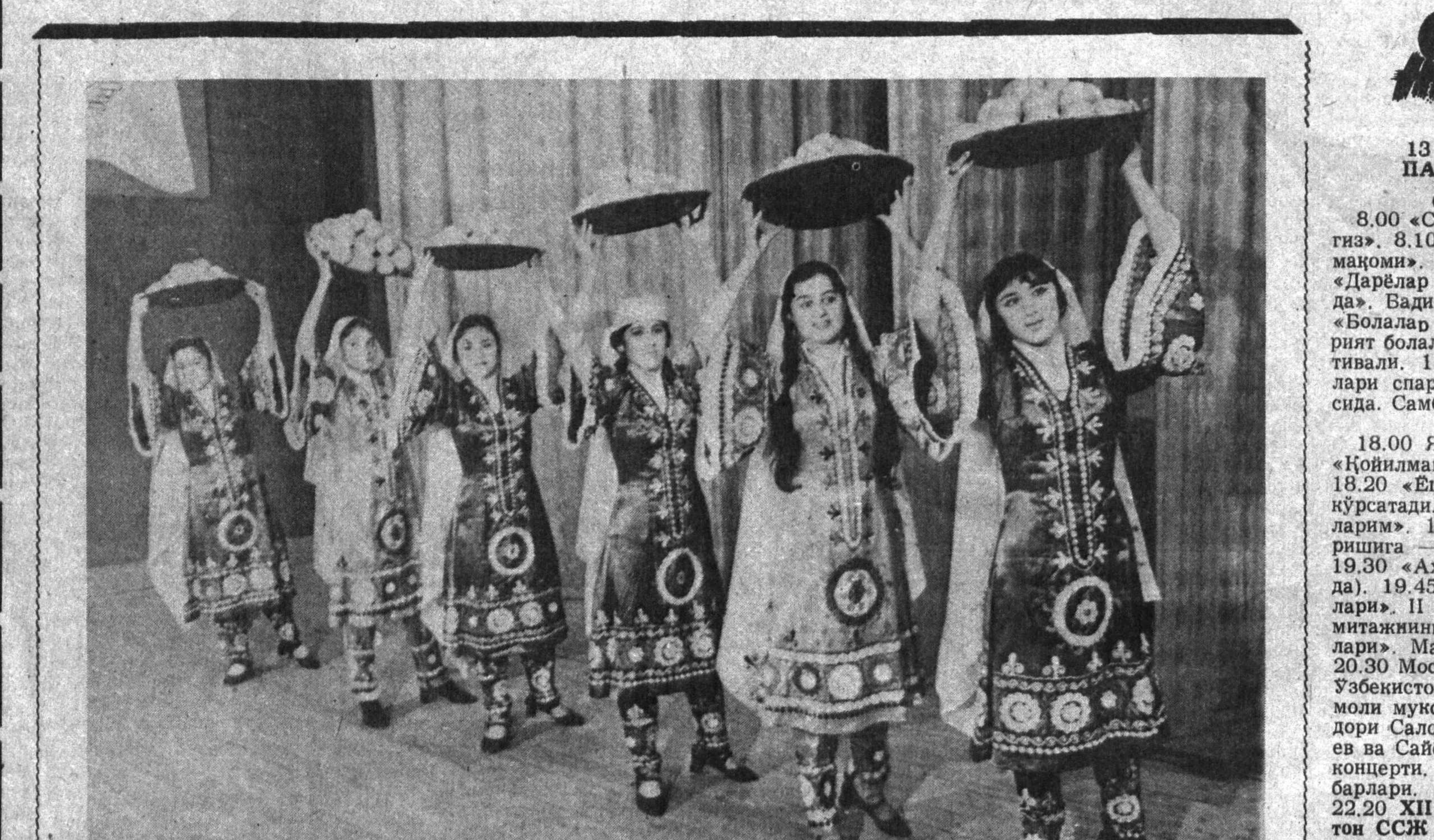
Ўзбек халқи санъати жуда мураккаб. Уни бошқа халқ вакиллари маромга етказиб ижро қилиши, томошабинларини лол қолдириши қийин. Лекин санъаткорларимиз хоҳ у хонанда бўлсин, хоҳ раққосаю-созанда бўлсин, бошқа халқлар: афғон, тожик, араб, ҳинд, хитой, эрон...