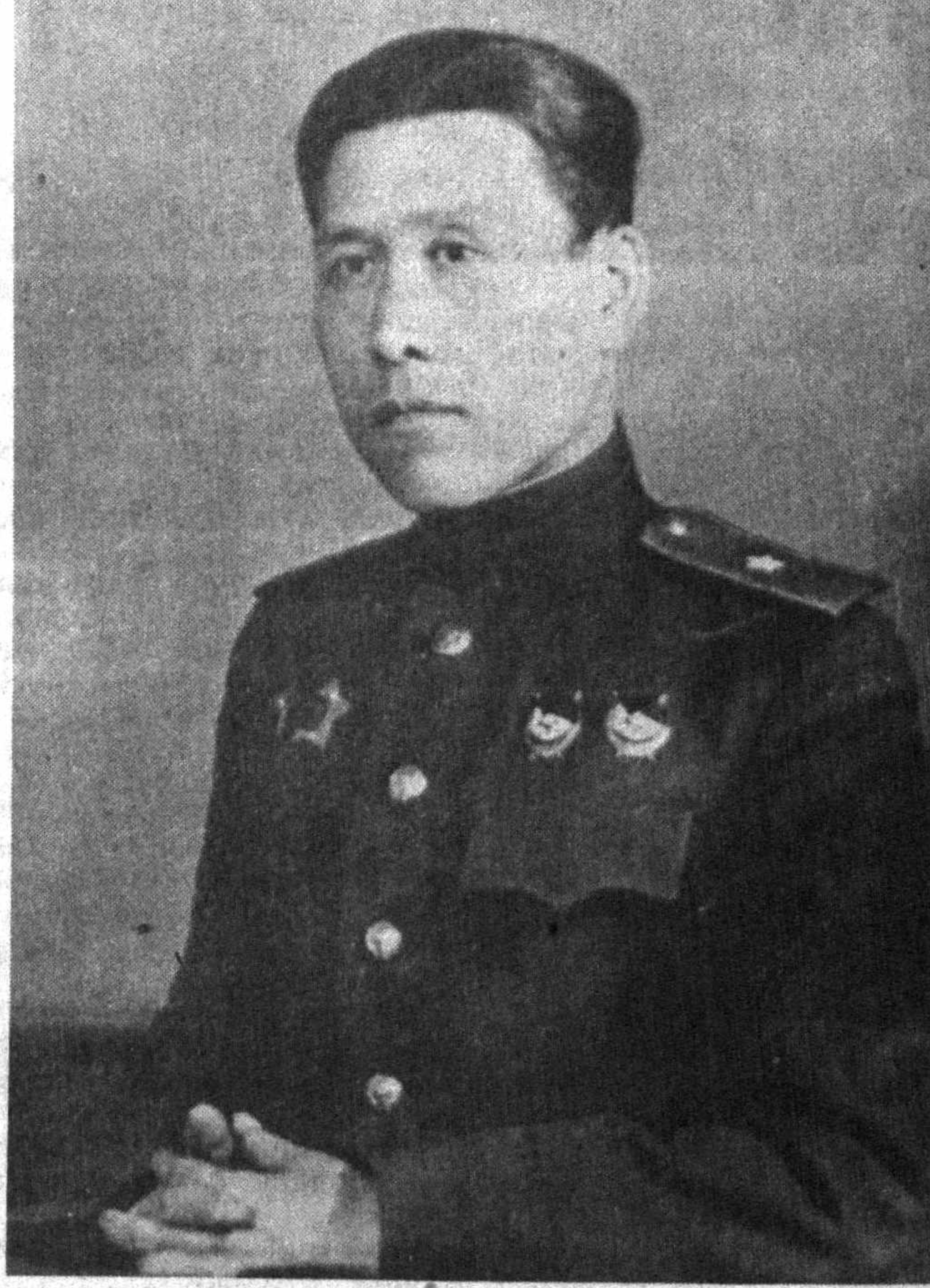
Янғроқ қўшиқларини тугамас ҳали, Мағшўм хотирага қўймасан гайялар. Бугун ҳам ўзбекининг мард генерали, Кўешии қўради ҳаммадан аввал! (Мағшўр ўзбек генералларидан бири Собир Раҳимовнинг ушбу сурати 1945 йилнинг январда олинган).

Ғафур ҒУЛОМ. ВАҚТ Ғува очилгуча ўтган фурсатни Капалак умрига қибс эттулик, Ваънда бир нафас олгудик мударат — Минг юлдус сўниши учун еттулик. Яшаш соатининг олтин напгари Ҳар бориб келиши олам замон Кониот шу дамда ўз кўрасидан Ясаб чиқа олур янгидан жаҳон. Ярим соат ичда туғилиб, ўсиб, Яшаб, умр қўриб, ўтувчилар бор. Кўз очиб юмгуча ўтган дам — қиммат, Бир лаҳза мазмуни бир бутун баҳор. Бир онинг баҳосини улчомақ учун Олтидан тарозу, олмосдан тош оз. Нурлар қадамла — чопан секундининг Барини тутолмас айдоҳаннос овоз. Илгит термулади қизнинг қўзғига, Киприк сувлиши, майин табассум... Қўшақариноққа муҳр бўлади Ҳаётда икки лаб қовушган бир зум. Яшаш дарбозаси остонасидан Зарҳал китоб каби очилур олам. Тириндик кўрқидир меҳнат, муҳаббат. Фурсатдир қилгучи азия, муқаррам. Бебаҳо дамларнинг тирик жони биз. Ҳар он ўтишининг юз йилга тенг.