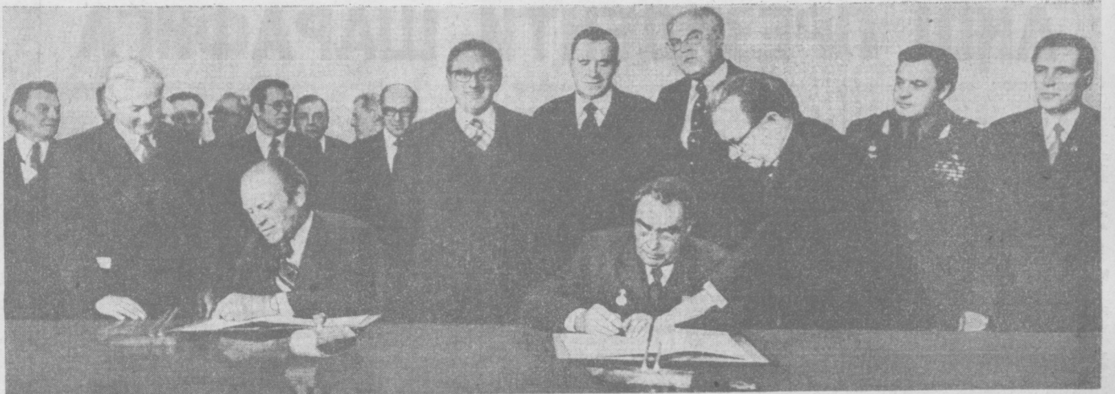
Совет-Америка хужжатларини имзолаш пайти.

ВЛАДИВОСТОК. 23 ноябрь (ТАСС). Аморина Қўшма Штатларининг президенти Жеральд Форд КПСС Марказий Комитети Бош секретари Л. И. Брежнев билан учрашмоқ учун бугун Владивостокка келди. Совет Иттифоқи ва Америка Қўшма Штатларининг давлат байроқлари билан безатилган Владивосток аэропортида самолёт пиллапоси ёнида Ж. Форднинг КПСС Марказий Комитетининг Бош секретари Л. И. Брежнев, КПСС Марказий Комитети Сийёсий бюросининг аъзоси, СССР Ташқи ишлар министри А. А. Громико, СССРнинг АҚШ даги элчиси А. Ф. Добрынин кутиб олдилар. Аэродромда АҚШ президентини граждан авиациясининг министри Б. П. Бугаев, КПСС Приморье ўлка комитетининг биринчи секретари В. П. Ломанин, КПСС Марказий Комитети Бош секретарининг ёрдамчиси А. М. Александров, Приморье ўлка ижroiа комитетининг раиси И. И. Штодин, Қизил байроқ ордени, Узоқ Шарқ ҳарбий округи қўшинлари қўмондони, армия генерали В. И. Петров, Қизил байроқ ордени Тинч океан флотининг қўмондони вице-адмирал В. И. Маслов ва бошқа расмий ишлар ҳам кутиб олдилар. Ж. Форд билан бирга давлат секретари, президентнинг миллий хавфсизлик масалалари билан шугулланувчи ёрдамчиси Г. Киссинжер, АҚШнинг СССРдаги элчиси У. Ж. Стессел, давлат департаментининг маслаҳатчиси Х. Соннефелд қатнашдилар.