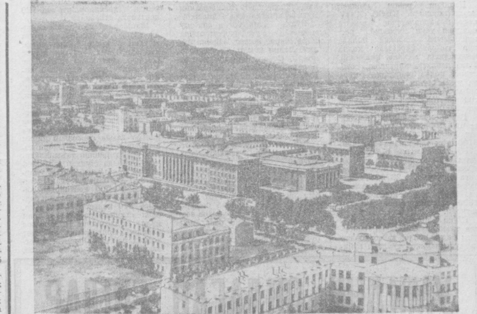
МХР пойтахти Улан-Батор

И. Т. НОВИКОВ, СССР Министрлар Ўринбосари. (АПН).