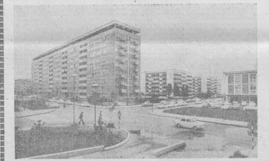
Белград урушдан кейинги йилларда тубдан қайта ўзгарди. Гитлерчилар вайрон этган шаҳар қайта тикланди, янада гўзаллашди. Суратда: янги Белград кўчаларининг бирида. В. Егоров фотоси. ТАСС фотохроникаси.

БАПРУТ. Тель-Авив Ливанга қарши қуролли ивгоарликларини давои эитирмоқда. Исроил ҳарбий ҳаво кучларининг самолётлари бугун кечати кўп давомида ана шу мамлакатнинг осмон четларининг бир неча марта бузиб ўтди. Арзуб район каттиқ тўпга тутилди. Исроил ҳарбий катерлари Антирақра яқинида Ливаннинг территориядан сувларида яна пайдо бўлди. Исроил авиацияси бугун арзалаб жанубий Ливан осмонидида ивгоарлик парвозларини яна бошлади. Икки самолёт Байрут устидан ўчиб ўтди.