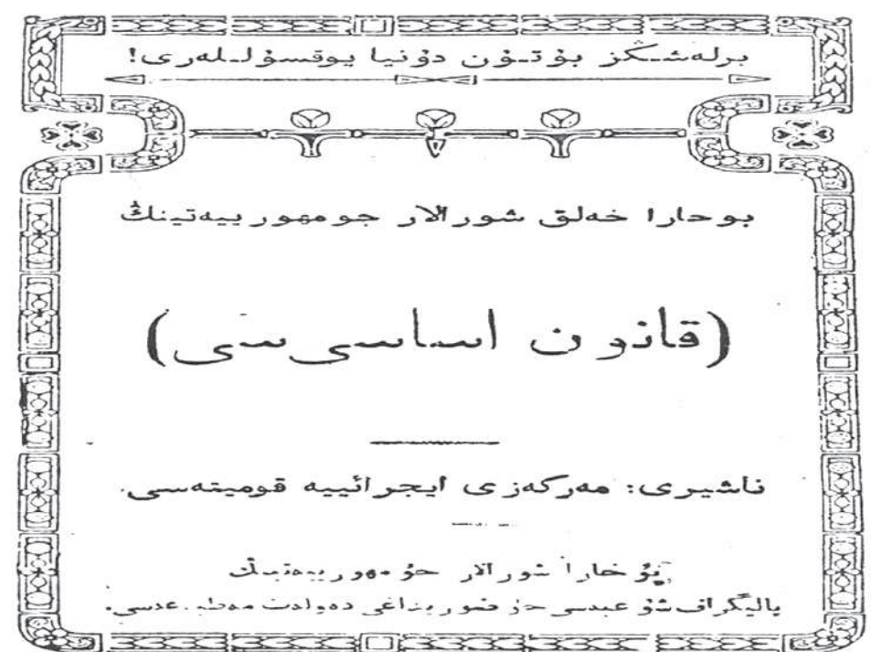
Бухоро жумҳуриятининг асосий қонуни (Конституцияси), 1921. Китоб номи: “Бухоро халқ шўролар жумҳуриятининг қонуни асосийси”, деб ёзилган.

22. Саҳро, биёбон, кўҳистон ва шаҳар халқини қадимдан бери ўртага кўюб муштара-