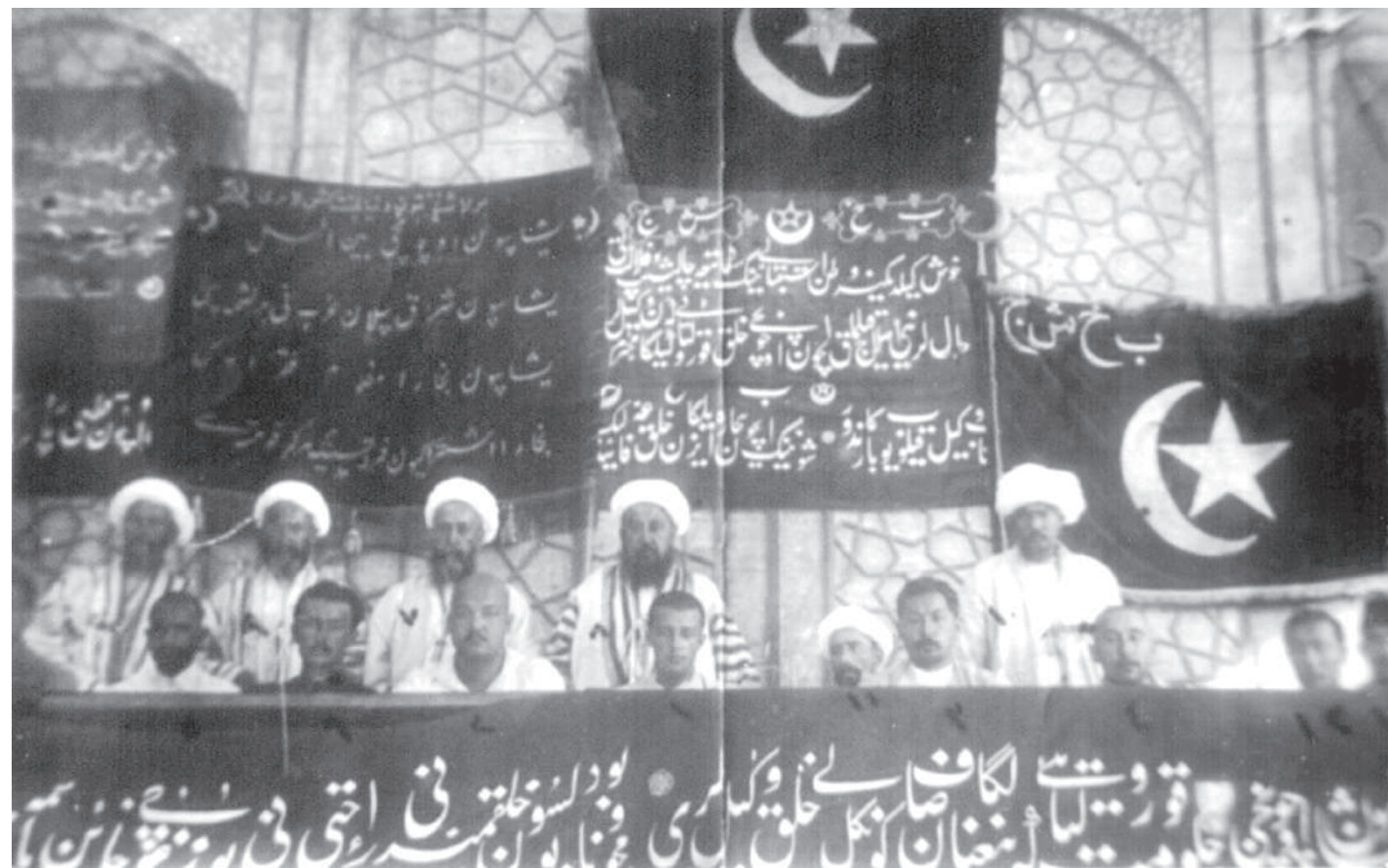
Бухоро жумҳуриятининг 1921 йилдаги 3-курултойи.

гача русча “совет” ва “республика” сўзлари ишлатилмади. Лекин 1923 йилда давлат номидаги “шўролар жумҳурияти” атамаси ўрнига “совет республикаси” атамаси киритилди, 1924 йилда бу икки давлатнинг номи яна бир марта қуйидагича ўзгартирилди: Бухоро совет