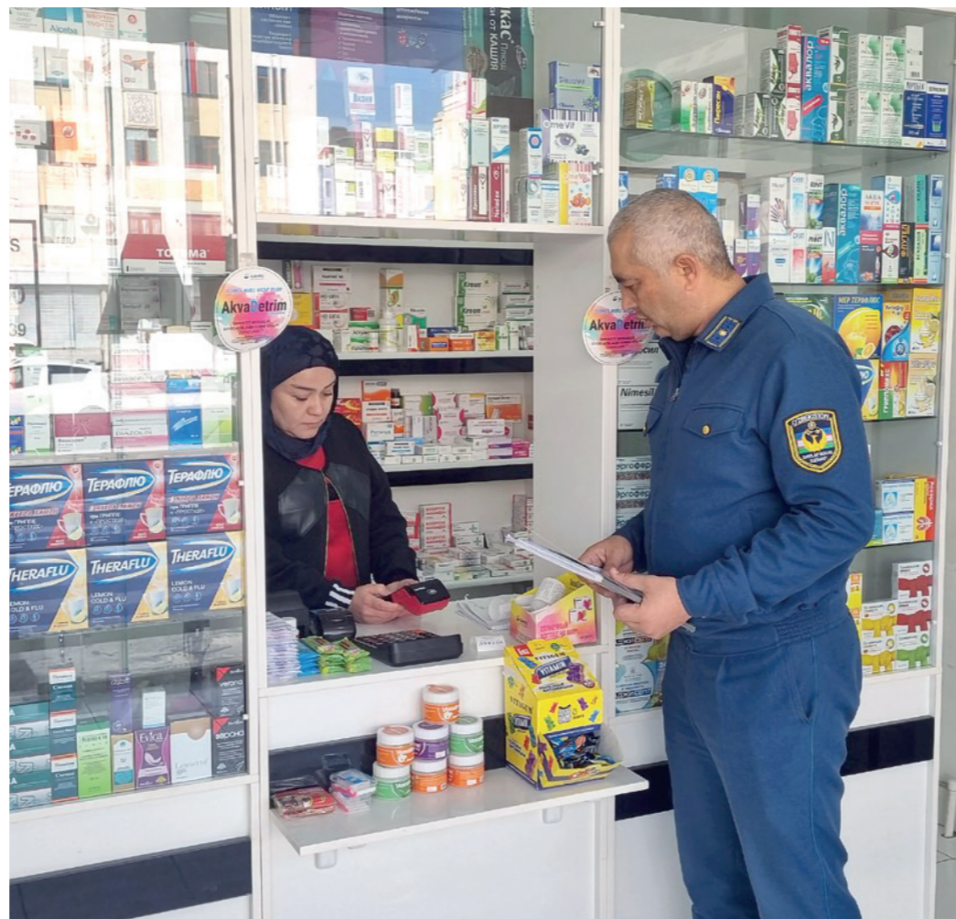
Амалдаги меҳнат қонунчилигини билмасдан кунлик иш ҳақини нақд пул кўринишида олиб юрган 9 нафар фуқаронинг фаолиятини легаллаштиришга эришдик.