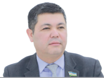
Нодир ТИЛАВОДДИЕВ, Олий Мажлис Қонунчилик палатаси депутати.

Президент раислигида 20 февраль куни ижтимоий ҳимоя соҳасидаги устувор вазифалар муҳокамаси юзасидан ўтказилган видеоселектор йиғилишида ушбу