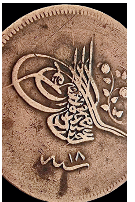
"40 пора" қийматдаги қизил мисдан зарб қилинган танга Усманийлар сулоласи султони Султон Абдулмажид I ҳукмронлиги даврига тегишли танга бўлиб, 1839 йилда Константинополда зарб қилинган.