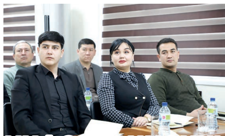
Комитет по развитию конкуренции и защите прав потребителей Республики Узбекистан организовал для представителей пресс-служб территориальных органов семинар-тренинг по повышению эффективности работы с населением в государственных органах, обеспечению открытости, укреплению и расширению сотрудничества со СМИ.