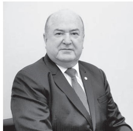
Каландар Абдурахманов. Академик.