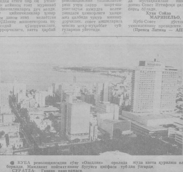
КУБА революциясидан сўнг «Оозлик» оролида жуда катта қурилиш олиб борилди. Мамлакат пойтахтнинг бугунги қиёфаси тубдан ўзгарди. СУРАТДА: Гаваиа пано рамаси.